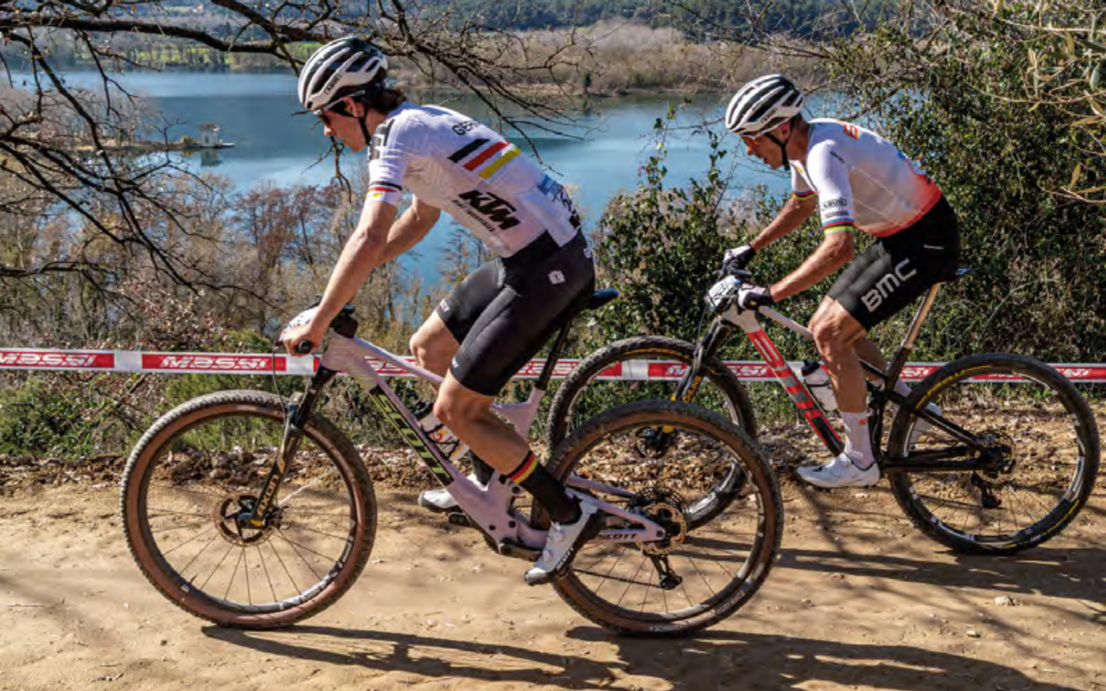
La prova de BTT va reunir més d'un miler de participants d'uns 35 països diferents.