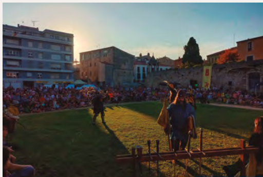
Aloja 28 i 29 de setembre del 2024