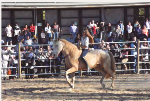
Fira de Sant Martíà 15, 16 i 17 de novembre del 2024