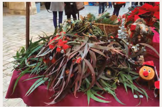
Fira de Nadal i Mostra d'oficis artesans 14 i 15 de desembre del 2024