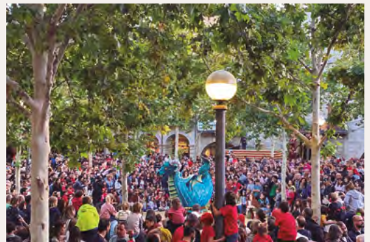
Festa Major Del 17 al 21 d'octubre del 2024