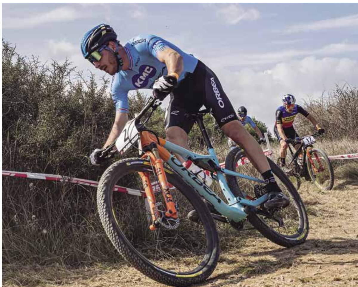
Banyoles va viure l'últim cap de setmana de febrer apassionant de Mountain Bike al parc de la Draga i el Puig de Sant Martíà

El dimarts 23 de març la ciutat va acollir una contrarellotge individual amb un circuit de 18,5 quilòmetres amb inici i final a Banyoles, i que transcorria també per Fontcoberta i Porqueres. Va ser una etapa en què els atractius de la ciutat i la comarca van arribar a prop de 190 països d'arreu del món retransmesa per canals com ara Esports3, Teledporte, Eurosport, Claro Sports a Llatinoamèrica, NBC Sports als Estats Units, Zhibo TV a la Xina o SBS a Austràlia. Un total de 175 ciclistes repartits en 25 equips professionals, amb la presència de l'elit del ciclisme mundial, van competir a Banyoles i la victòria la va aconseguir el ciclista australià Rohan Dennis (Ineos Grenadiers).