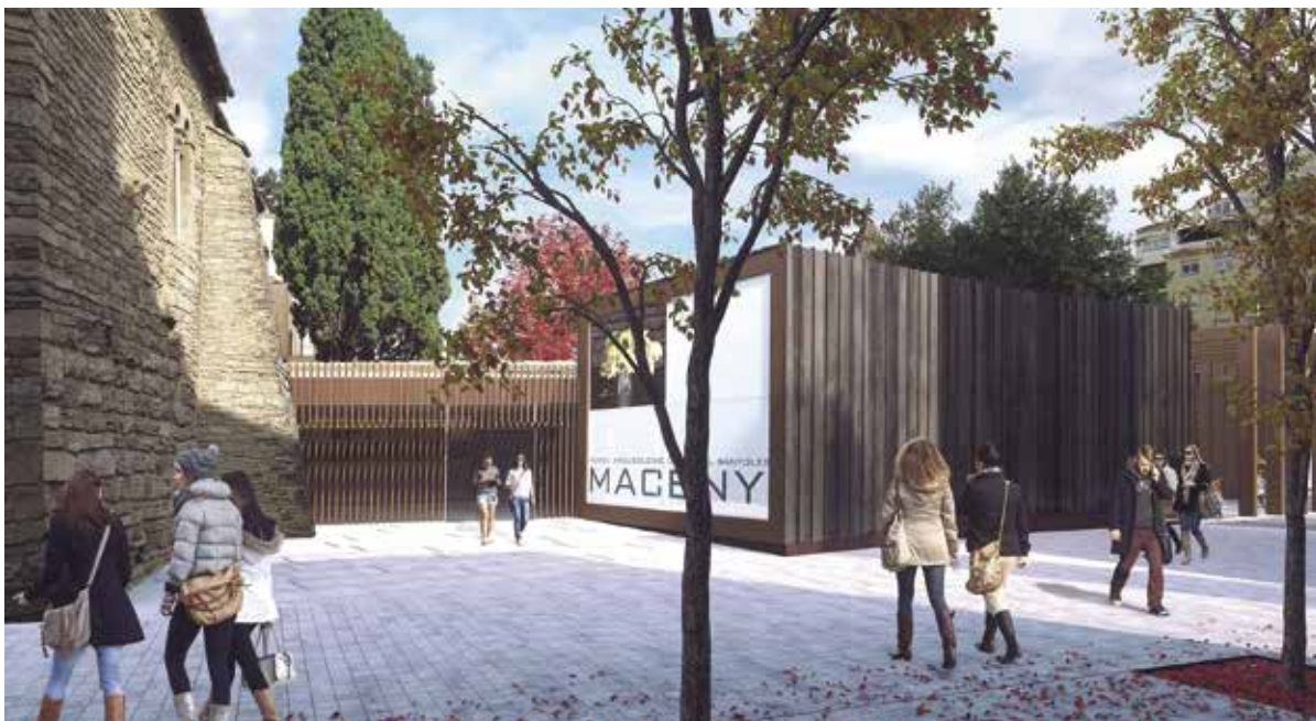
Simulació de com serà el Museu Arqueològic i el seu entorn

L'equip Birulés, Cabré, Romans, Arquitectes, que va presentar la proposta Omeia, s'encarregarà de redactar la proposta definitiva de projecte bàsic i executiu per a la reforma i ampliació del Museu. En la seva resolució, el jurat destaca que Omeia és "coherent i respectuosa, no només amb les preexistències del conjunt d'edificis que constitueixen avui el museu", i "que la millora els espais a l'entorn del museu, especialment la plaça que es forma al sud de la muralla, resultat d'anivellar les antigues hortes amb el nou carrer de la Pia Almoina i obrint-lo a la zona verda existent".