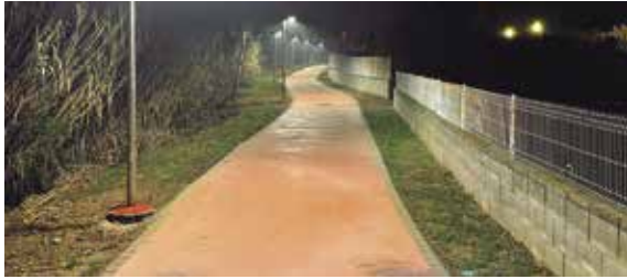
És al tram entre la carretera de Vilavenut i l'avinguda de la Farga

Es tracta del tram entre la carretera de Vilavenut i l'avinguda de la Farga. Coincidint amb la construcció de la nova via verda que creuarà Banyoles, el consistori ha instal·lat una nova il·luminació en el tram que transcorre paral·lela a la riera de Canaleta. El nou enllumenat és tipus led i més eficient energèticament i, a partir de la mitjanit, disminueix la intensitat. També s'ha renovat la il·luminació als carrers Progrés, Nostra Senyora del Collell i Pedreres. Les dues actuacions han suposat una inversió de prop de 47.000 euros.