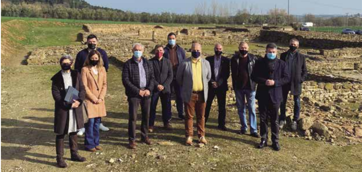
La vil·la romana de Vilauba es troba immersa en un pla de millora i reordenació per museïtzar-la definitivament i convertir-la en un parc arqueològic

La nova condició com a BCIN suposarà que Vilauba passi a formar part dels circuits de difusió escolar i turística a nivell de Catalunya i d'Europa, a més d'optar a subvencions més importants per part d'administracions superiors. El procés d'incobació per aconseguir la declaració de BCIN es va iniciar el 2019 per iniciativa dels quatre propietaris del jaciment: els ajuntaments de Banyoles, Camós i Porqueres i el Centre d'Estudis Comarcal de Banyoles.