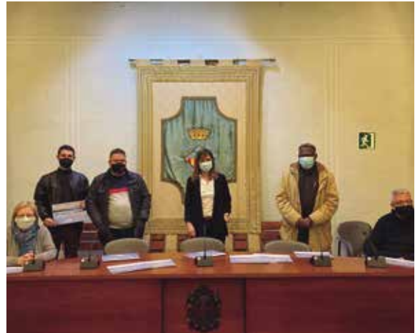
El Calendari de les Religions s'ha editat per primera vegada

L'Ajuntament de Banyoles i l'àrea de Benestar Social del Consell Comarcal del Pla de l'Estany, juntament amb el programa ICI de 'la Caixa', van presentar aquest calendari que integra durant l'any les principals festivitats de les tres religions que han col·laborat en el projecte: la parròquia de Banyoles, representada per la Congregació de les Butinyanes, la mesquita Nur dels banyolins d'origen subsaharià, la Mesquita Houda dels banyolins d'origen marroquí i el temple Fe, Esperança i Amor del protestantisme evangèlic. L'objectiu és trobar espais comuns, ponts de diàleg i concòrdia, i donar a conèixer la riquesa de totes les religions.