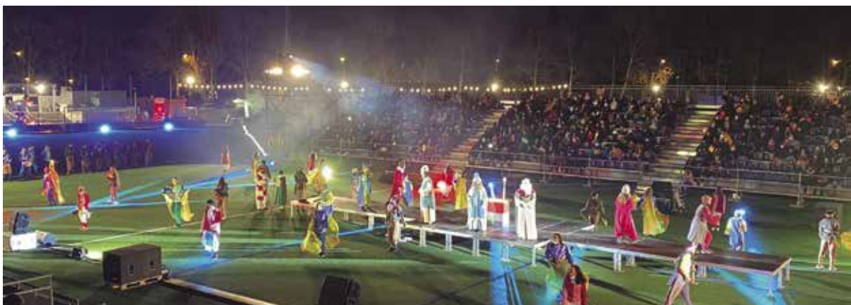
La màgia dels Reis d'Orient va omplir de música i llum l'Estadi Miquel Coromina i Morató

L'acte de benvinguda dels Reis d'Orient es va celebrar el dimarts 5 de gener a l'Estadi Miquel Coromina en cinc sessions diferents. Cadascuna d'aquestes sessions tenia una capacitat per a 500 persones, amb totes les mesures de seguretat i prevenció, i entrada gratuïta. L'acte d'arribada dels patges es va emetre en directe per Banyoles Televisió i pel que fa a l'Amibaixada Reial es van organitzar visites virtuals.