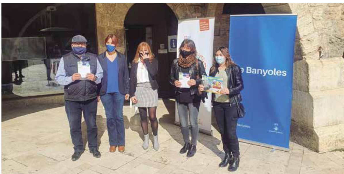
Els guanyadors i guanyadores rebent els vals de regal del Fora-stock: 100 euros, 200 euros, 300 euros i un viatge a Menorca per a dues persones

El Fora-stock va ser l'activitat alternativa del Firestoc, reinventant-se en un format que va combinar la venda presencial amb la venda on-line a través de la plataforma de comerç local. La iniciativa promovia els descomptes en moda, complements i complements per a la llar coincidint amb el període de rebaixes i es va desenvolupar tant presencialment com virtualment als establiments comercials adherits. Els clients podien trobar les millors ofertes en roba, calçat, complements, roba per a la llar, alimentació i esport que oferien els comerços de Banyoles des dels seus mateixos establiments o bé des de la plataforma de comerç local en línia ( https://www.ddgi.cat/comerc-a-casa/banyoles/public/ ).