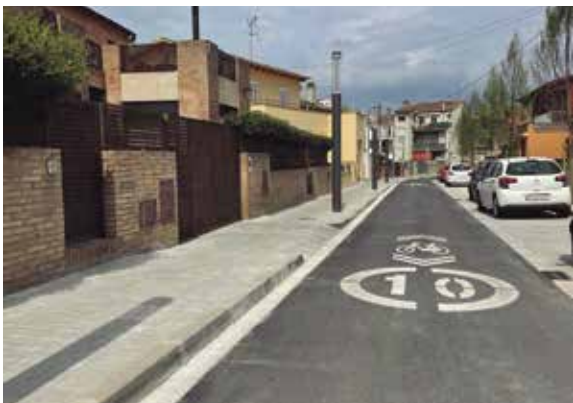
Obres d'urbanització del darrer tram del carrer Divina Pastora.

L'Ajuntament de Banyoles ha finalitzat les obres d'urbanització del darrer tram del carrer Divina Pastora, entre els carrers Mossèn Baldiri Reixac i Mossèn Constans. Els treballs han suposat una inversió de 153.504,50 euros i han permès urbanitzar el carrer amb la construcció de voreres, la millora del ferm i la renovació de l'enllumenat i de l'arbrat. El nou disseny del carrer s'ha fet d'acord amb els veïns i veïnes afectats.