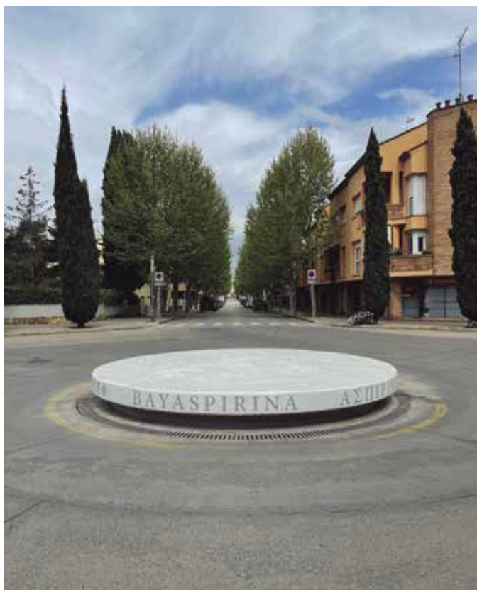
L'Ajuntament de Banyoles ha restaurat la plaça dels Jurats, coneguda popularment com a plaça de l'Aspirina

La rotonda es va construir l'any 1987 dins el projecte de reforma del Passeig Mossèn Lluís Constans. Deu anys més tard i quan ja era coneguda com la plaça de l'Aspirina, a iniciativa d'un grup d'artistes i intel·lectuals locals, l'artista Jordi Bosch 'Barraca' va convertir-la en una escultura dedicada al reconegut analgèsic. L'Ajuntament de Banyoles va encarregar la restauració a l'artista Jaume Geli consisten en la neteja de la base de formigó, s'ha reformat la base i s'ha repintat.