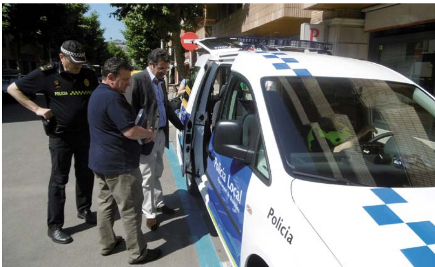
Els vehicles de la Policia Local de Banyoles pateixen un fort desgats ja que estan tots els dies funcionant