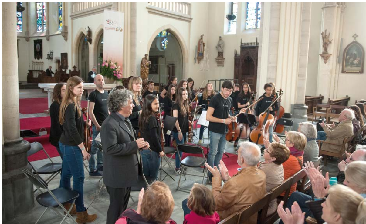
L'Escola Municipal de Música de Banyoles actuant a Bèlgica