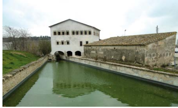
La bassa de la Farga d'Aram amb les noves millores