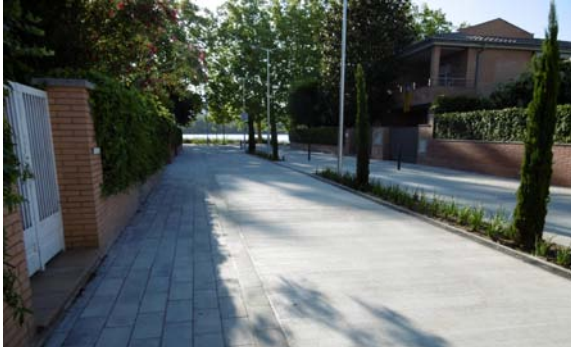
El carrer de Barca permet accedir a peu comodament a l'Estany