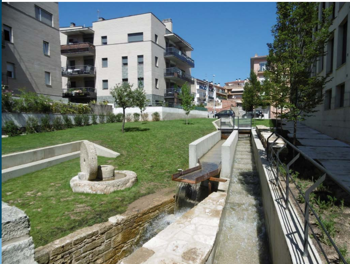
La zona millorada és a l'entorn del rec Major