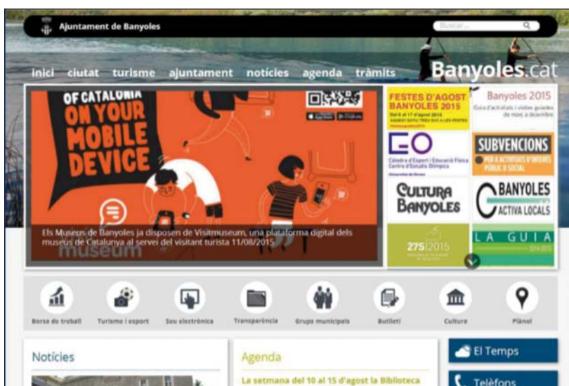
Un dels apartats més destacats del web banyoles.cat són les notícies

examen basat en 41 indicadors diferents i dels webs de tots els ajuntaments de Catalunya. Els indicadors inclouen informació sobre l'alcalde, del govern i dels grups municipals a l'oposició, la publicació de les actes dels plens, o el pressupost o l'execució del pressupost, entre d'altres.