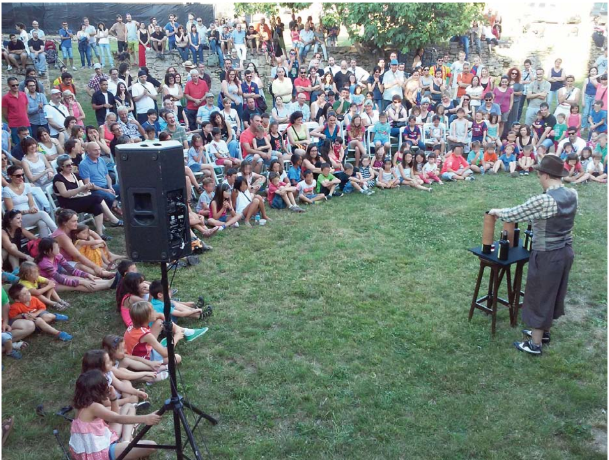
Èxit de públic del Festival de Màgia al Carrer "Troba'm"