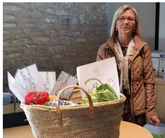
Una de les guanyadores del cabàs de la campanya del Mercat

Era la segona edició de Gartstròmia, la fira de la gastronomia i l'art de la comarca del Pla de l'Estany. El Gartstròmia incloïa un mercat de productes de Banyoles i de la comarca, degustacions a càrrec de diferents establiments, tallers i demostracions. Enguany es van ampliar les activitats incorporant més l'art a la fira. Tot plegat amb un cap de setmana amb moltes activitats i tallers, com ara l'elaboració d'un paper germinador del molí de la Farga, a càrrec de l'Escola de Natura, o un taller de pintura amb l'ajuda del pintor Gonzalo Tabuenca.