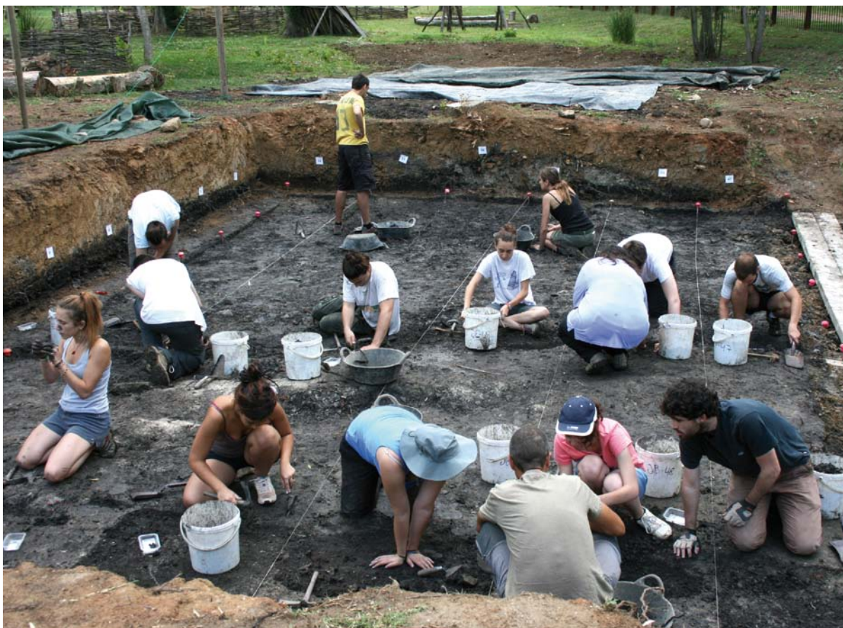
La zona de les excavacions d'aquest 2015 al jaciment neolític de la Draga

Es tracta de les obres de rehabilitació del terra, el sostre i les parets de l'actual sala d'Història, en una superfície d'uns 200 metres quadrats situada a la planta baixa de la Pia Almoïna. El Museu Arqueològic Comarcal de Banyoles, situat a la placeta de la Font, ja ha superat la meitat de les obres que comportaran una reforma integral. Abertis Autopistas aporta a l'Ajuntament de Banyoles 141.571,51 euros amb càrrec a l'1% Cultural corresponent a les obres d'ampliació de l'autopista AP-7 al seu pas pel Pla de l'Estany.