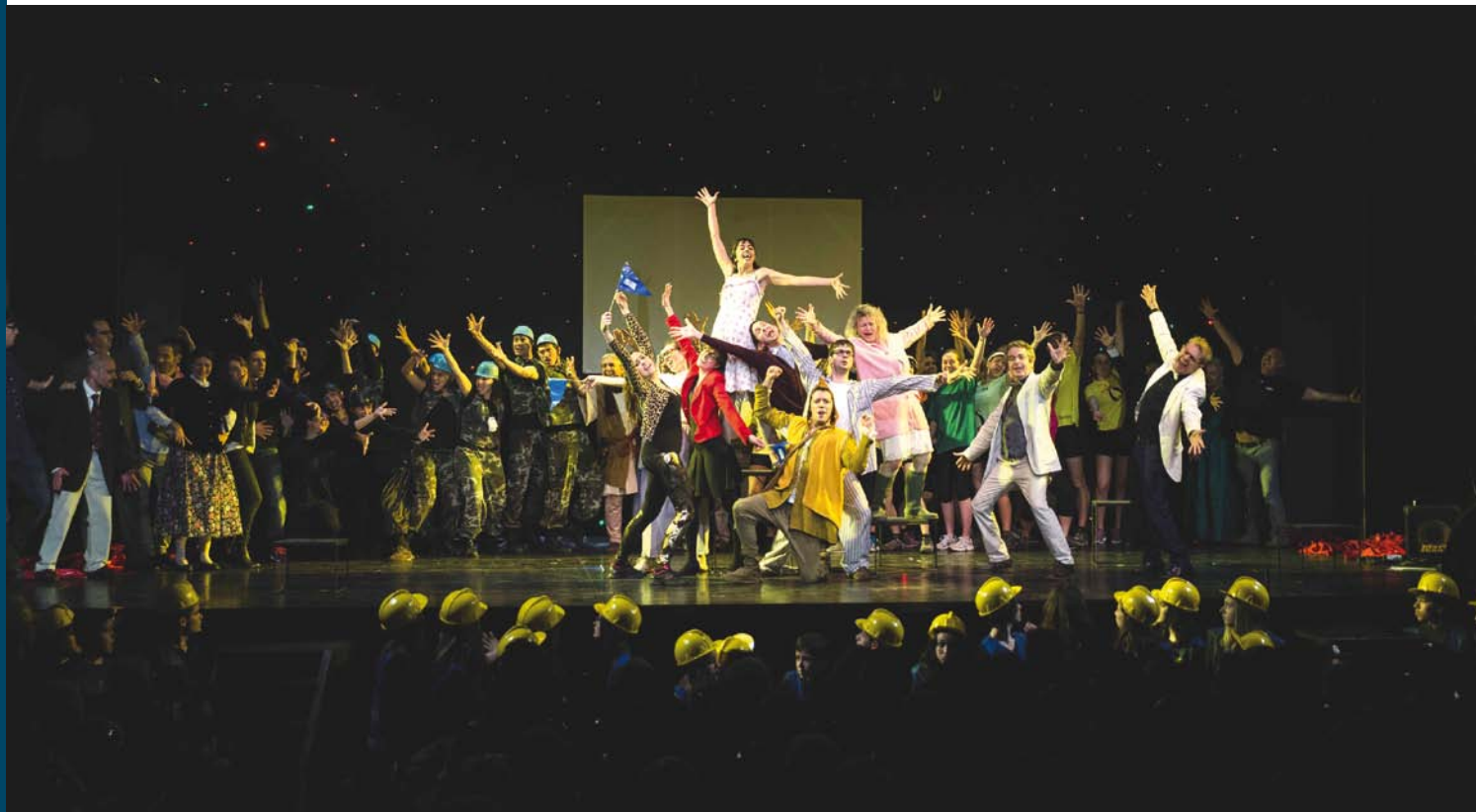
Obra dels 20 anys del Teatre Municipal.