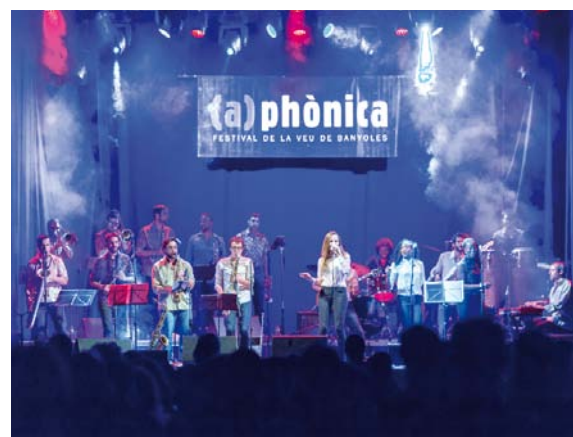
The Gramophone Allstars Big Band actuant a l'(a)phònica