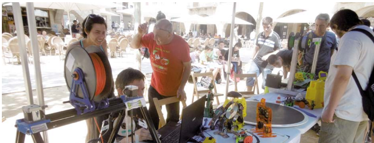
Alguns dels treballs durant l'acte de cloenda de l'activitat Robòtica Banyoles