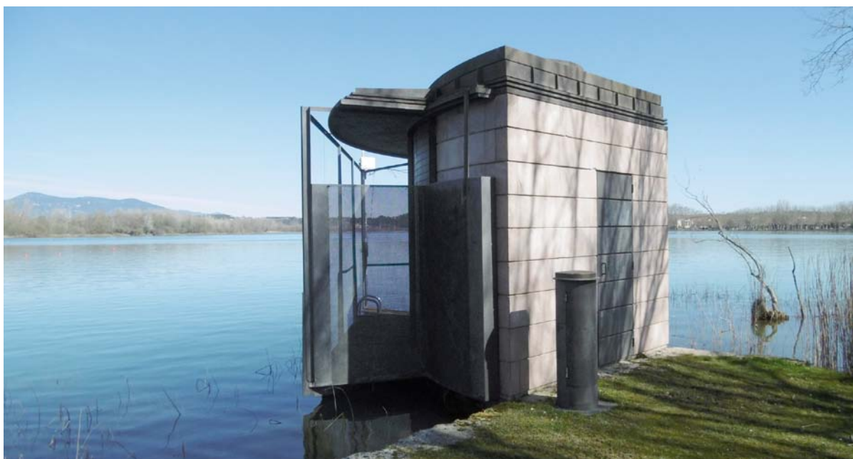
La pesquera Malagelada, està situada al passeig Magdalena Aulina, a prop de l'Estadi Municipal Miquel Coromina i Moretó, al sud de l'Estany

L'Ajuntament de Banyoles des de fa molt anys ha anat comprant, sempre que n'ha tingut l'oportunitat, els terrenys rústics situats a les vores de l'Estany de Banyoles. En aquest sentit, l'Ajuntament de Banyoles ha comprat a dues famílies dues finques rústiques situades al Paratge Lió, en el terme de Banyoles. En total uns 11.000 metres quadrats més de terrenys del voltant de l'Estany. Així doncs, el consistori banyolí incorpora aquests terrenys al bé comunal de l'Estany de Banyoles per tal de crear una reserva de sòl no urbanitzable de titularitat municipal per preservar el medi ambient, i els valors naturals i paisatgístics.