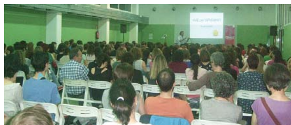
Víctor Küppers va omplir la sala de gom a gom

Gairebé 400 persones van escoltar Víctor Küppers a l'escola Can Puig en el marc del programa Eduquem en família, que enguany ha acomplert els seus primers cinc anys. Una de les idees principals de la xerrada va ésser que la vida és una qüestió d'actitud; el que fa valuoses les persones, a més dels seus coneixements i habilitats, són les actituds. Víctor Küppers va destacar una frase "el més important a la vida és que allò més important sigui el més important".