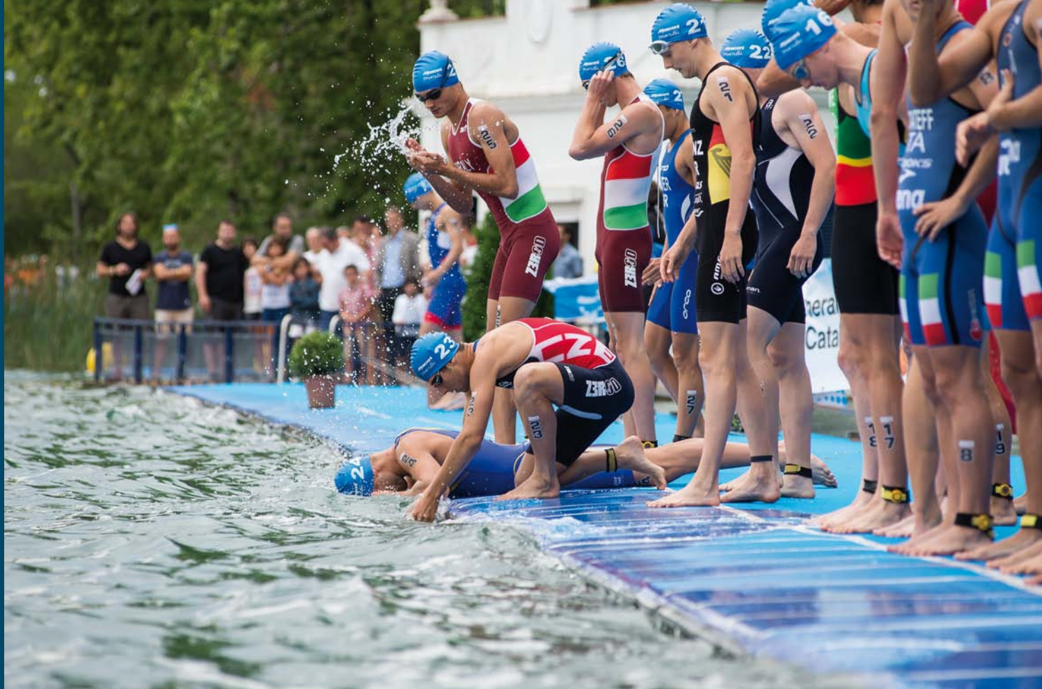
Els triatletes a punt de començar la prova de natació a l'Estany.