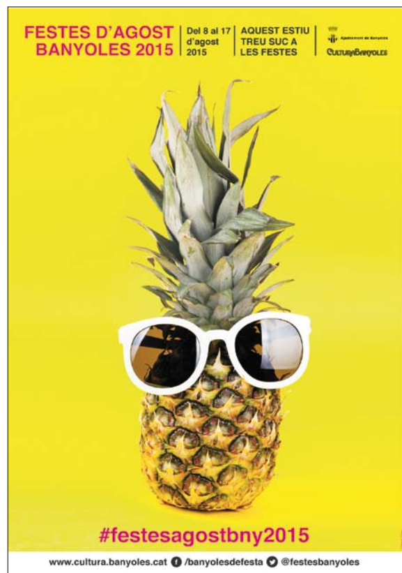
Cartell de les Festes d'Agost de Banyoles del 2015