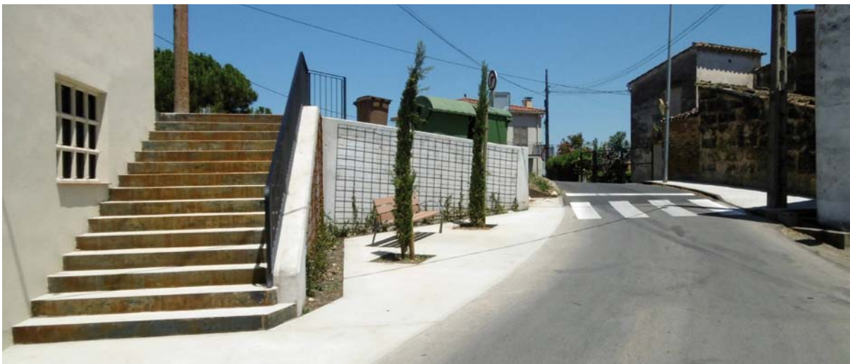
La cruïlla d'accés al Camí dels Prats presenta una nova imatge

Les ordenances fiscals d'aquest 2015 contempen una rebaixa de més de 100 euros per tramitar canvis de nom, ja que es va observar que al padró de sepultures hi constaven molts títols a nom de difunts. En alguns casos els canvis de nom no es tramitaven perquè la taxa per la transmissió que es cobrava era de 138,54 euros. Les ordenances fiscals per l'any 2015 van contemplar una rebaixa d'aquest import fins als 20 euros. L'Ajuntament continuarà regularitzant les dades dels títols funeraris del cementiri de Banyoles durant el 2015.