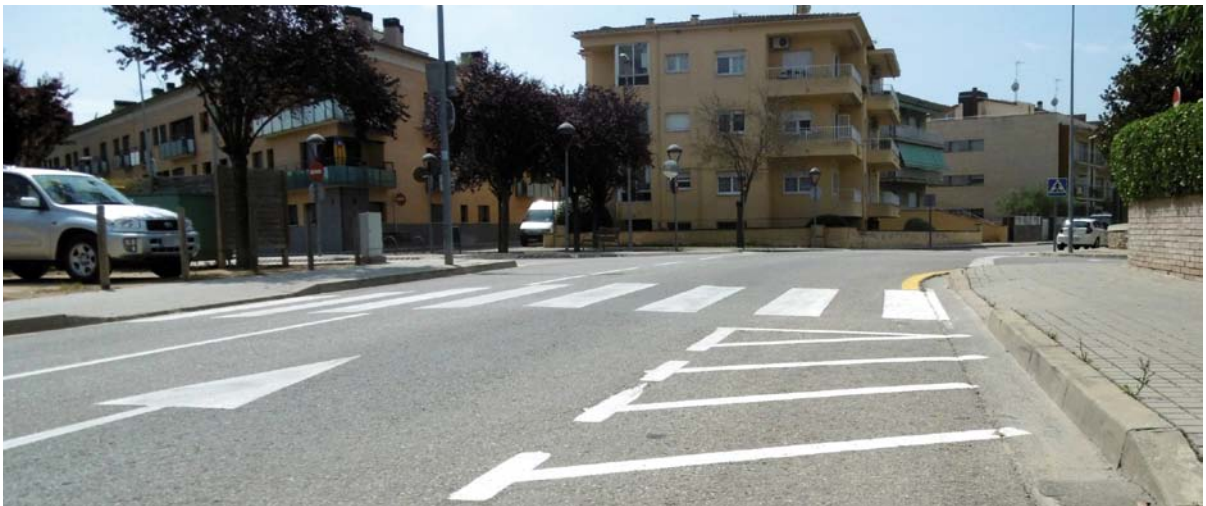
Zona repintada al carrer Sardana

s'han repintat els passos de vianants i altres senyalitzacions del passeig de la Draga. Una altra repintada que era necessària ha estat als estacionaments del carrer Conill. També s'han pintats els símbols de bicicletes i persones de la zona del carril bici de l'Estany i del carril bici del passeig mossèn Lluís Constans.