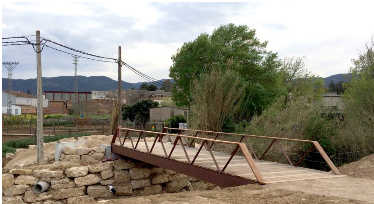
Últims preparatius abans de posar en funcionament la nova passarel·la de la riera Canaleta