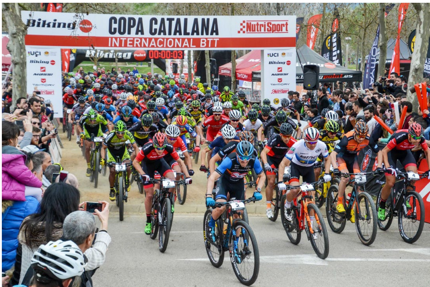
Espectacular sortida de la prova masculina de la Copa Catalana Internacional BTT Biking Point de Banyoles.

Victor Koretzky i Pauline Ferrand-Prévo van guanyar una multitudinària Copa Catalana Internacional BTT Biking Point de Banyoles. El nou format de la prova va superar les expectatives de l'organització. S'estima que al llarg del segon cap de setmana de març 12.000 persones van gaudir d'un veritable espectacle. Un total de 700 bikers van ser a la sortida del parc de la Draga, que aquest any estrenava la categoria Hors Class.