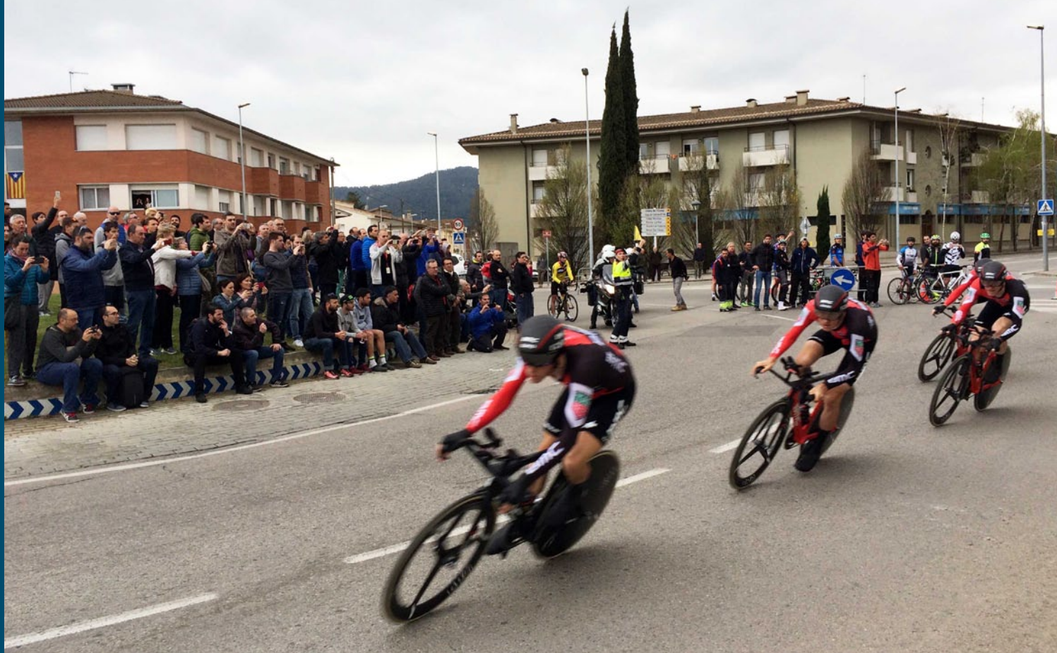
L'equip BMC va guanyar finalment l'etapa de Banyoles després de la sanció a l'equip Movistar