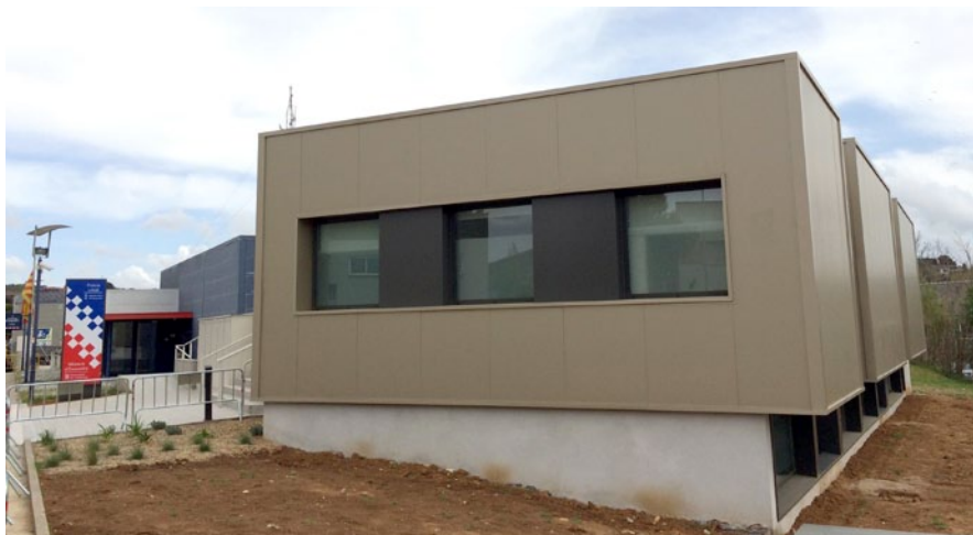
Imatge exterior de la nova comissaria de la Policia Local de Banyoles