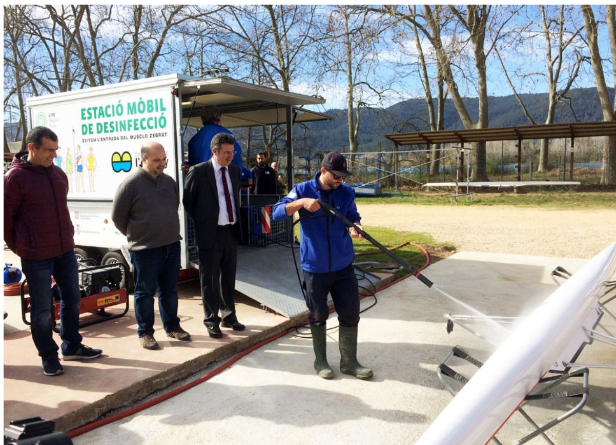
Els canvis i danys, tant ecològics com econòmics, que pot provocar el musclo zebra poden arribar a ser enormes

Els canvis i danys, tant ecològics com econòmics, que pot provocar aquesta espècie exòtica invasora poden arribar a ser enormes. L'Estany de Banyoles no està exempta d'aquesta amenaça i per aquest motiu s'han de posar en marxa accions importants de prevenció com és el cas de l'estació mòbil de desinfecció per evitar l'entrada d'aquesta espècie. Des de l'any 2012 l'Agència Catalana de l'Aigua realitza un control de les aigües de l'Estany dins la xarxa de seguiment de Catalunya per confirmar la presència o absència de musclo zebra; fins a dia d'avui els resultats ens indiquen la no presència a la zona.