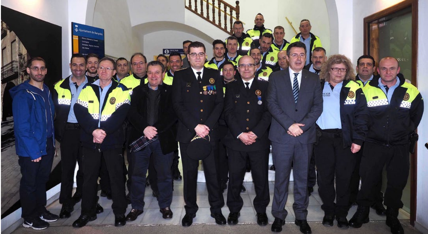
Foto de grup de la Diada de la Policia Local de Banyoles.