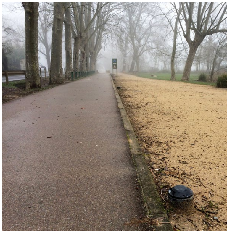
Renovació de la il·luminació del carril bici de l'Estany de Banyoles entre l'Estadi municipal Miquel Coromina i l'estanyol del Vilar

Aquestes obres ja han començat i està previst que durin uns 3 anys. Es millorarà considerablement l'abastament a la zona i es dotarà als abonats d'un cabal d'aigua més important i amb més pressió. La primera zona acabada és al carrer Joaquim Hostench, des de la plaça de Sant Pere al carrer Remei, i el tram oest del carrer Pintor Solives fins al carrer Pare Butinyà. A més, s'ha aprofitat per treure les barreres arquitectòniques i convertir aquesta zona en un espai adaptat per a persones amb mobilitat reduïda.