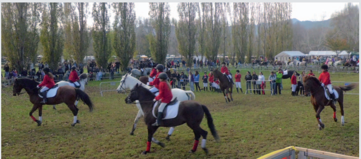
Els cavalls són uns dels protagonistes de la Fira de Sant Martíà

El cap de setmana era ple d'activitats amb concursos morfològics, la participació d'alumnes d'hípiques de la comarca, tast de productes catalans, la medalla del "Burro d'or" de l'associació Foment de la raça asinina catalana, 120 parades al Mercat d'artesanía o la Fira del dibuix i la pintura. A més, per qui volgués hi havia el bar-restaurant de la Fira. La fira multisectorial i comercial Firestany dins del pavelló de la Draga era un dels atractius i enguany va arribar als 60 expositors. Tanmateix, la pluja del dissabte a la tarda i el diumenge a la tarda van deslluïr la Fira i va provocar una disminució de visitants respecte de les edicions anteriors.