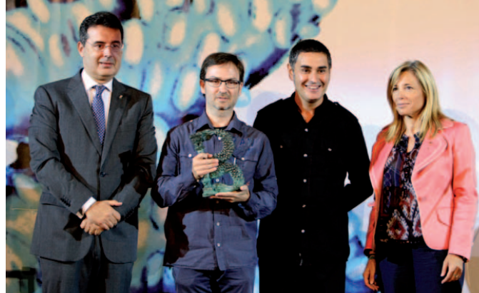
Cor de Teatre és el guanyador del premi Banyolí de l'Any.

Els Premis Banyolí de l'Any són una iniciativa de l'Ajuntament de Banyoles, que compta amb el suport