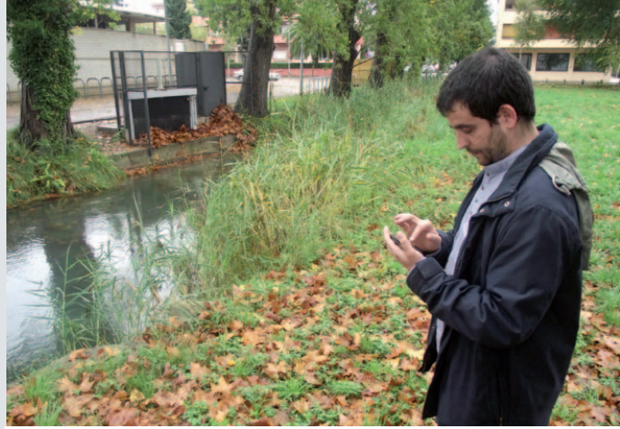
Un tècnic de l'Ajuntament activa, mitjançant un telèfon mòbil, la comporta del col·lector del rec de Ca n'Hort

Des de fa poques setmanes funciona mitjançant el telèfon mòbil. La comporta inclou un sensor de nivell que permet tenir informació per obrir-la i tancar-la. A més, la comporta es pot regular en diferents posicions segons les necessitats de desguàs. El 2009 es va automatitzar la comporta del col·lector situada a l'inici del rec de Ca n'Hort, a tocar de les instal·lacions del Club Natació Banyoles. Aquest és un dels dos col·lectors que serveixen per desguassar l'aigua de l'Estany en moments de fortes pujades del nivell de l'Estany i així evitar que vessi.