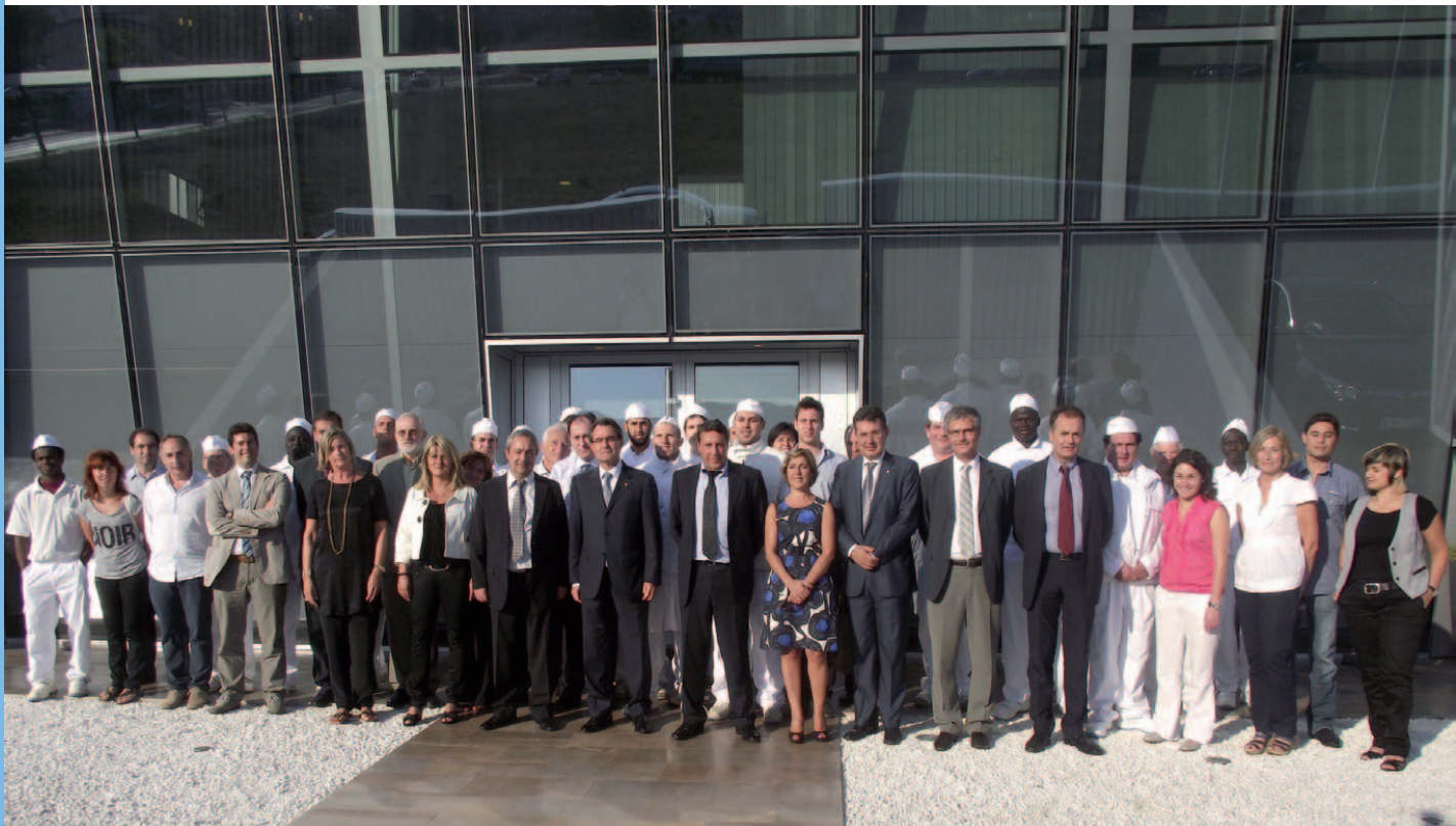
El President Mas a l'empresa banyolina escorxador Roca

Després de visitar l'Ajuntament de Porqueres, el president Mas va inaugurar les noves instal·lacions de Vidresif. Aquesta empresa ha posat en marxa enguany un nou forn per trempar vidre de grans dimensions, acompanyat de maquinària totalment actualitzada, per a poder fer tot tipus de manufactures al vidre.