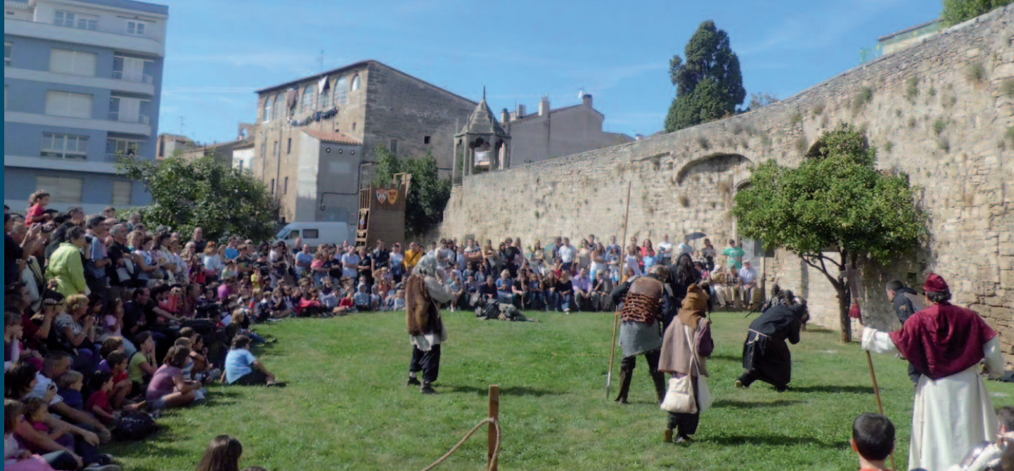
La Fira Aloja atrau molts visitants