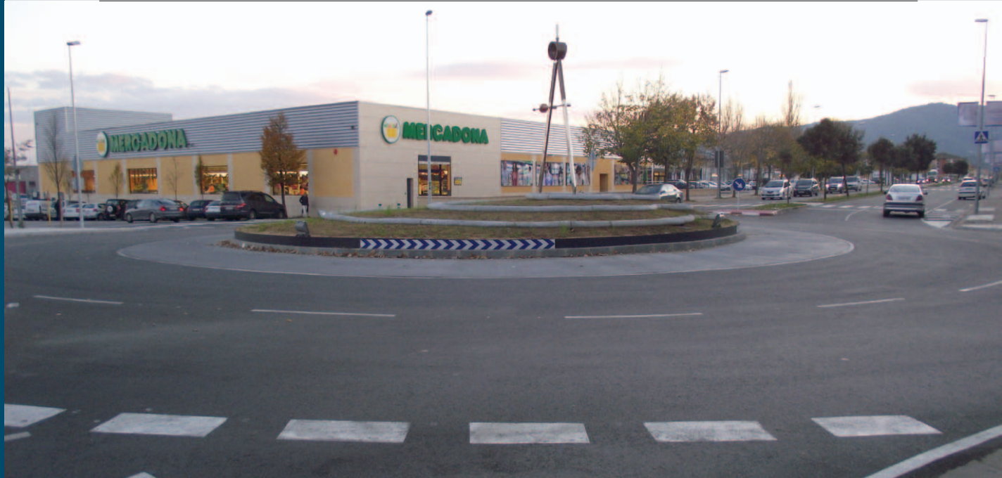
La nova rotonda de l'avinguda de la Farga