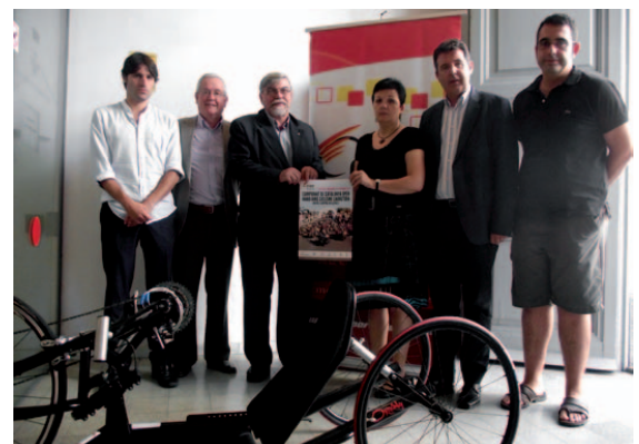
La presentació del Campionat de Catalunya Open Hand-bike amb una de les bicicletes

Banyoles va tornar a ser protagonista d'una prova esportiva rellevant els dies 17 i 18 de setembre amb el Campionat de Catalunya Open Hand-bike de ciclisme en carretera tant en ruta com en contrarellotge. Aquesta prova es desenvolupa amb una bicicleta de tres rodes preparada per a esportistes amb discapacitat i que s'impulsa amb el moviment dels braços. Hi van participar uns 30 esportistes, la meitat en la categoria d'elit i la meitat en la categoria de promoció. La prova d'elit de ruta era de 40 quilòmetres i la de promoció de 20 quilòmetres.