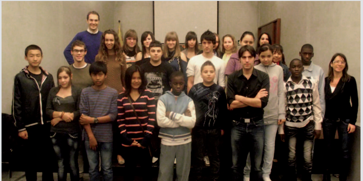
Un any més, i ja en són 5, continua el projecte Rossinyol

Dins el Pla Educatiu d'Entorn Banyoles-Forqueres ja s'han iniciat els tallers de suport a l'estudi, el projecte Rossinyol, el projecte d'Intervenció Socioeducativa Canaleta-Can Puig i que des del darrer cap de setmana de novembre s'ha establert un nou horari pels Patis oberts a l'institut Josep Brugulat, que serà de 3 a 6 de la tarda els dissabtes, diumenges i festius fins al final d'any.