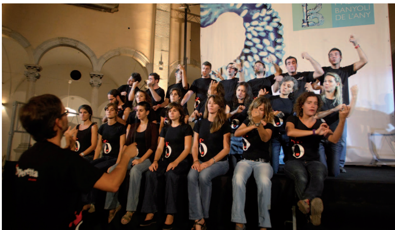
Actuació de Cor de Teatre a l'acte de lliurament dels Premis.

del Consell Comarcal del Pla de l'Estany, la Diputació de Girona, la Federació d'Organitzacions Empresariales de Girona (FOEG), "la Caixa", Agri-Energia, Bassols Energia, Aigua de Sant Aniol, EPSA, Coca-Cola, Nestlé, La Vanguardia, Damm, Raventós i Blanc, Frigorífics Cornellà, Frit Ravich i Liderou. Ràdio Banyoles i Canal Català Girona Pla són els mitjans de comunicació col·laboradors.