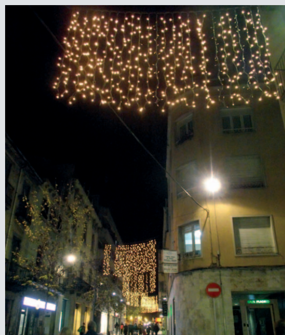
Els llums de Nadal del carrer Àngel Guimerà

Un any més el primer divendres de desembre l'Ajuntament de Banyoles va encendre els llums de Nadal que guarneixen els carrers i places durant aquestes dates nadalencues. Enguany l'Ajuntament ha mantingut els carrers i places il·luminats. S'han guarnit diferents espais del centre de la ciutat com ara el carrer Major, la plaça de les Rodes, la plaça Major o la plaça de la Font. Tanmateix, es continuen decorant zones més allunyades del centre de la ciutat com ara la plaça Catalunya a la Vila Olímpica, la plaça Sant Pere o la plaça Vilarrubias a la Farga. Aquest any també s'ha continuat amb la mateixa línia i s'ha guarnit la plaça Canigó al barri de Mas Palau i la plaça Pere Plantés i Badosa al barri de Can Puig. Sempre seguint el criteri de l'estalvi energètic, utilitzant únicament llums LED en tots els llums de Nadal de l'Ajuntament de Banyoles.