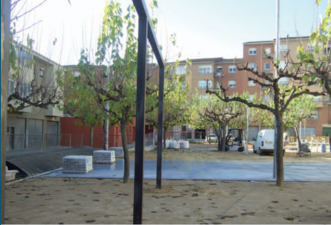
Les obres de la plaça de la Pau, al bell mig del barri de la Farga

Generalitat de Catalunya i l'Ajuntament de Banyoles. Les obres contemplen una intervenció sobre una superfície de 4.719 metres quadrats. L'ús general de la plaça de la Pau oferirà diversos espais diferenciats, entre els que destaquen, una zona d'estada, dues zones infantils, una zona d'activitats polivalents i zona d'aparcament marcat. Aquests espais estaran dotats de jocs infantils diferenciats per grups d'edats, de 3 a 7 i de 7 a 12 anys, bancs en les diverses zones i daus de formigó com a seients pensats per a espai per la gent gran, zona de pícnic, i dunes arbrades que segmentin l'espai interior i el perímetre de la plaça.