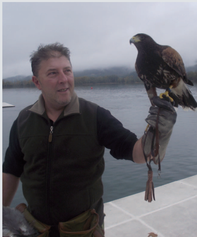
Un operari de l'empresa especialitzada amb una àliga

A partir del 2 de novembre del 2011 es va canviar la freqüència de la recollida del rebuig. Tots els contenidors de rebuig, que són de color verd, del