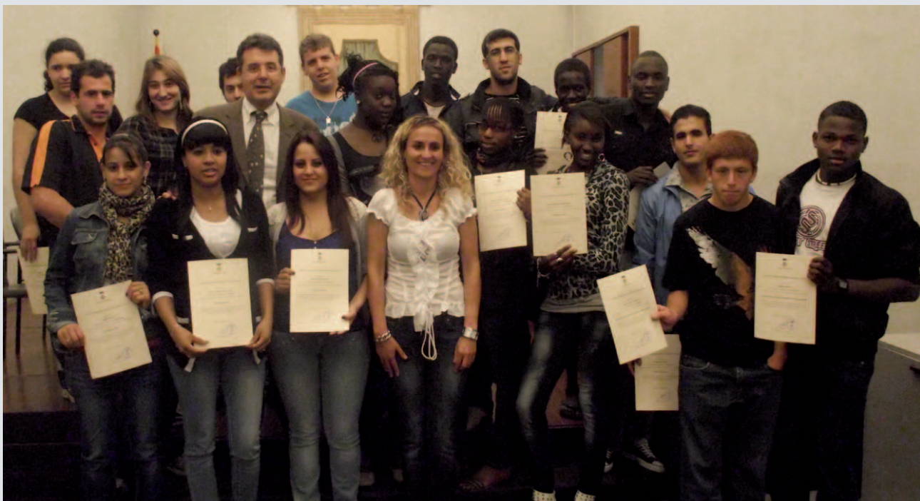
Fotografia de grup amb alumnes del programa Noves Cases per a Nous Oficis

programa Noves Cases per a Nous Oficis, promogut per l'Ajuntament de Banyoles, que es va iniciar el 14 d'octubre de 2010. El programa s'emmarca en el projecte Impuls-Treball, amb la voluntat d'oferir una alternativa a les desaparegudes Escoles Taller. Les Noves Cases per a Nous Oficis és un projecte cofinançat per la Generalitat, mitjançant el Servei d'Ocupació de Catalunya i el Fons Social Europeu. La Casa d'Oficis de Banyoles han ofert tres especialitats: tècnic d'espectacles, jardineria i promoció turística. Dins de cada mòdul s'impartia la preparació teòrica i pràctica en cada especialitat, així com la formació complementària en matèries bàsiques, amb l'afany de millorar les competències dels alumnes.