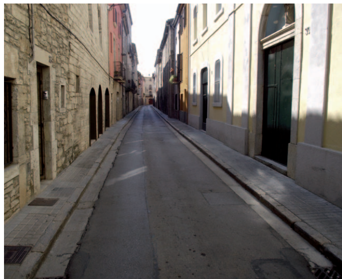
El carrer Nou millorarà la seva imatge

El carrer Nou és un dels carrers emblemàtics de la ciutat. El projecte d'arranjament del carrer Nou té un pressupost de 495.000 euros i compta amb una subvenció de 270.000 euros del Pla Únic d'Obres i Serveis (PUOSC) i d'una altra subvenció de 150.000 euros de l'Incasol.