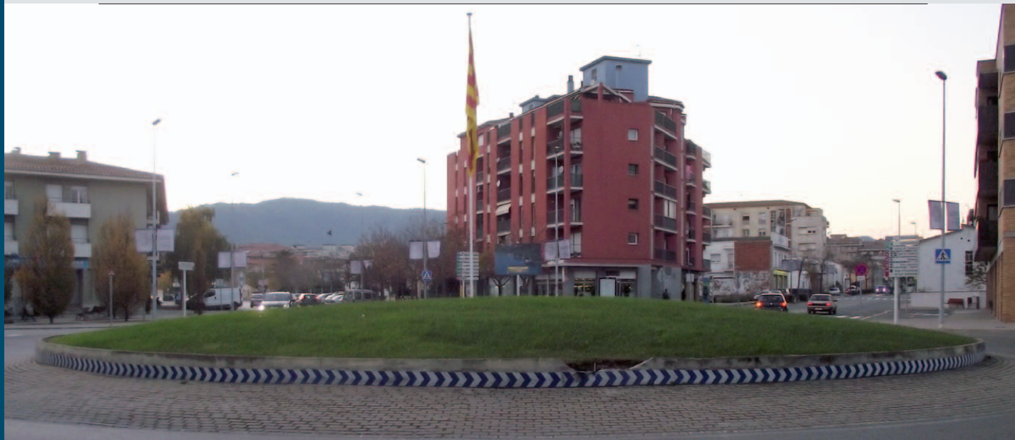
La senyera a la plaça Països Catalans