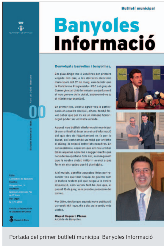
Portada del primer butlletí municipal Banyoles Informació

Amb l'edició d'aquest desembre del 2011 el butlletí municipal Banyoles Informació arriba al número 15, ja que va tenir una edició número 0. Des del seu inici, a l'abril del 2008, s'ha fet arribar el Banyoles Informació a cada habitatge de la ciutat amb les novetats més destacades dels últims mesos a Banyoles.