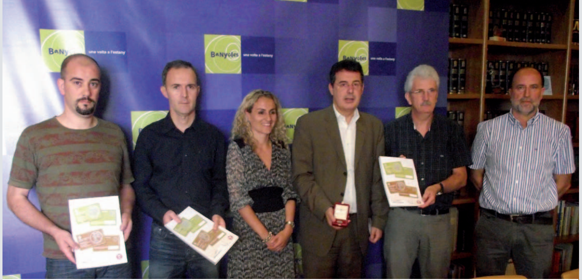
Roda de premsa de presentació de la campanya "Comprant + a Banyoles més hi guanyes"

Banyoles. Des del 17 d'octubre i fins el 17 de desembre del 2011, fent les compres als 70 comerços que formaven part de la campanya "Banyoles + i més", es rebien uns