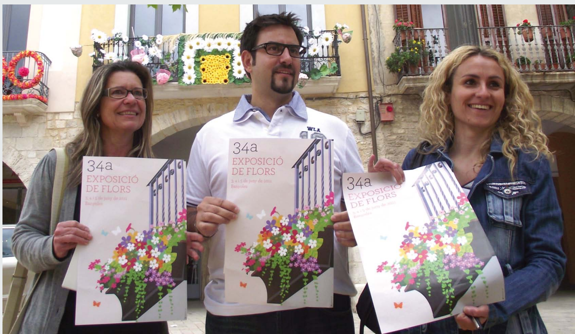
Presentació de l'exposició de flors a la plaça Major

A més, es van preparar activitats paral·leles com ara la presentació en societat del VII Juny gastronòmic, el clàssic tast de vins i formatges, un tast de gintònics, un sopar degustació, l'(a)rtista al plat i la sessió de combinats i música. Una altra novetat era la targeta promocional amb un descompte del 10% al segon menú, del 20% al tercer menú i del 25% de descompte a partir del tercer.