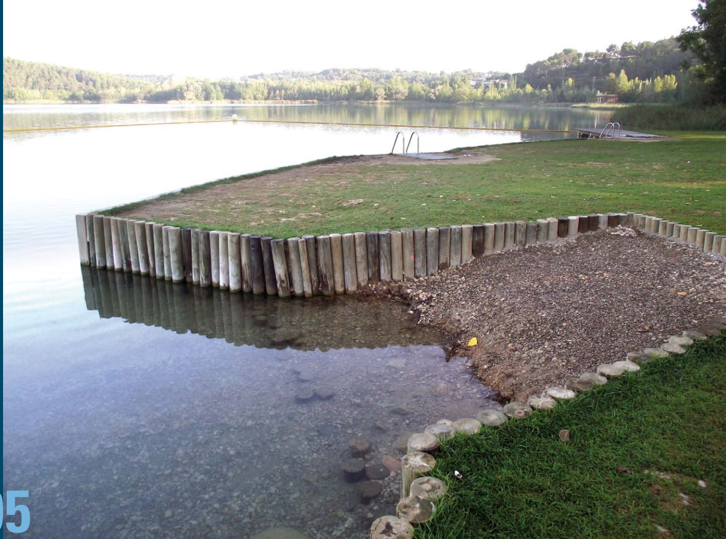
Perspectiva de la remodelada zona de bany de la Caseta de Fusta

da més amplia a la Caseta de Fusta per si cal entrar-hi per qualsevol incidència i disposa d'una entrada amb rampa a l'Estany per a les persones amb dificultats de mobilitat i els nens i nens, que també tenen un nou espai amb poca fondària. El cost total de l'obra és de 220.000 euros, finançats íntegrament pel Fons Estatal per a l'Ocupació i la Sostenibilitat Local.