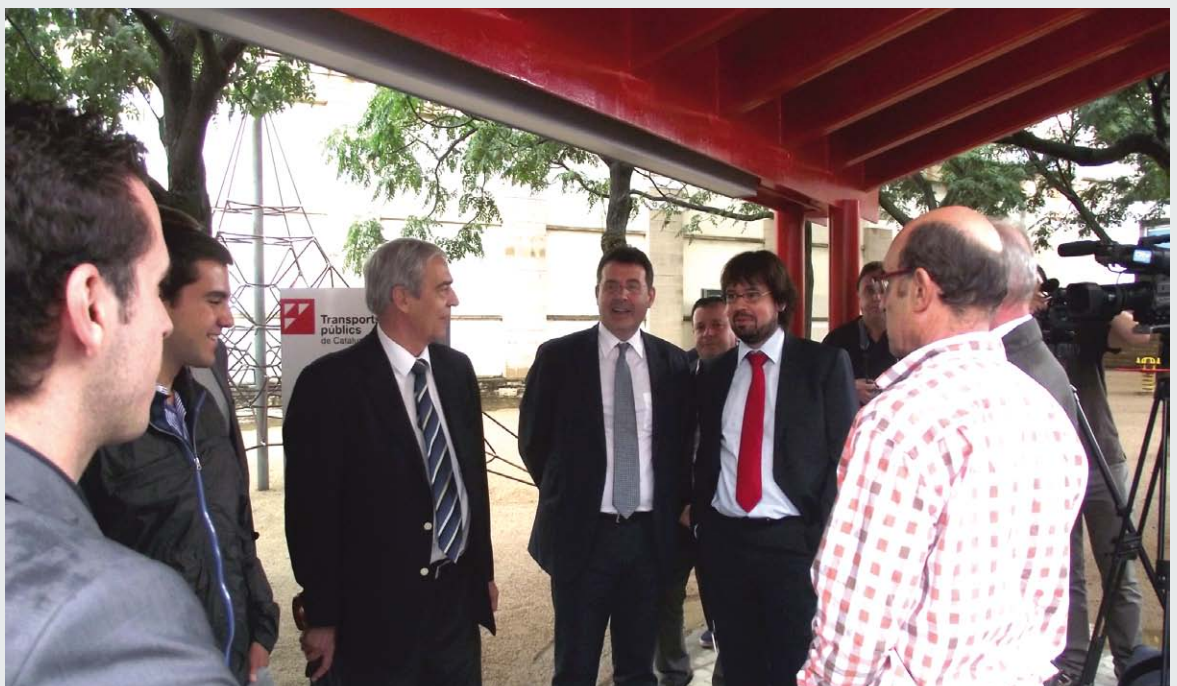
Les autoritats durant la inauguració de la nova parada

Els 5 cartells estan situats al passeig de la Indústria (al costat de l'Ajuntament), al carrer Àngel Guimerà, a la plaça Turers, al passeig Gaudí i al passeig mossèn Lluís Constans (a tocar de l'oficina de turisme). D'aquest cinc cartells, dos estan col·locats en zones d'entrada al Barri Vell, al carrer Àngel Guimerà i a la plaça Turers, i per aquest motiu s'ha aprofitat per afegir a l'altre costat del cartell informació sobre la mobilitat al Barri Vell.