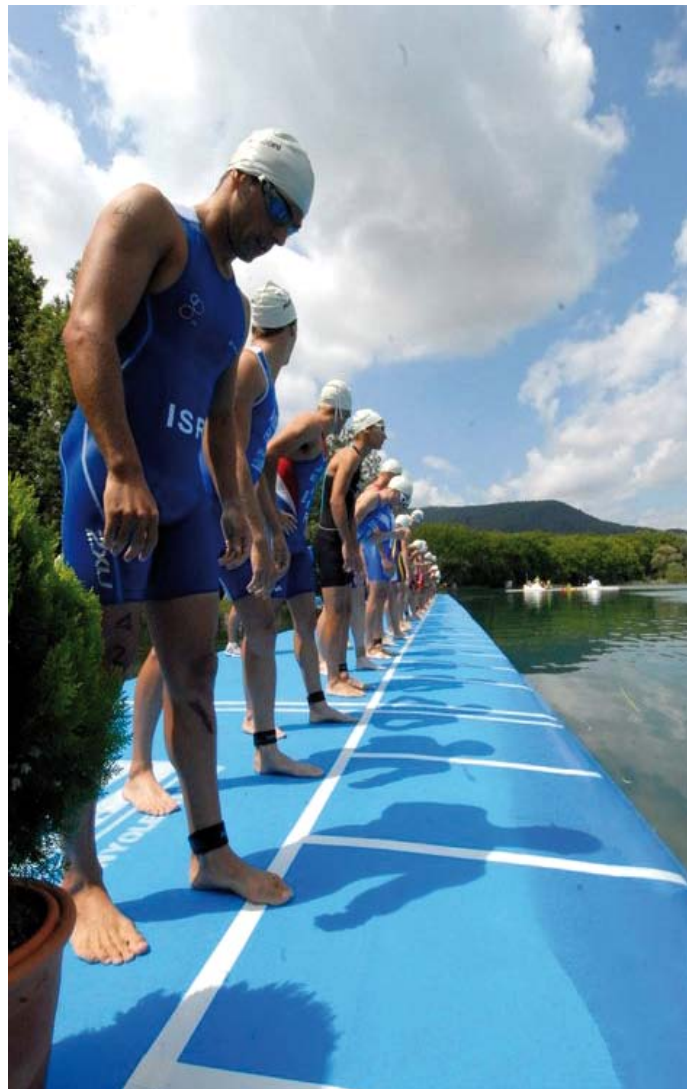
La prova masculina de la Copa d'Europa de Triatló de Banyoles a punt de començar