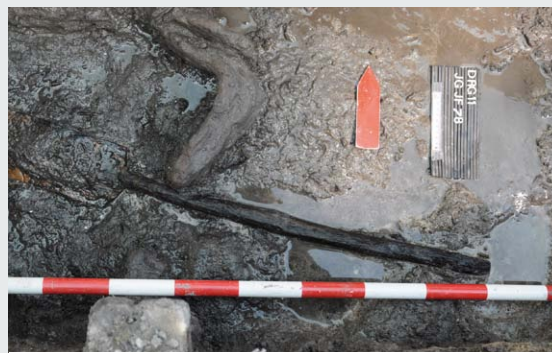
La pala de fusta de més de 7.000 anys

En el marc del nou projecte d'excavacions a la Draga que s'allargarà entre els anys 2008-2013, aquest any 2011 les excavacions enguany s'han dividit entre les subaquàtiques i un nou espai de 50 metres quadrats