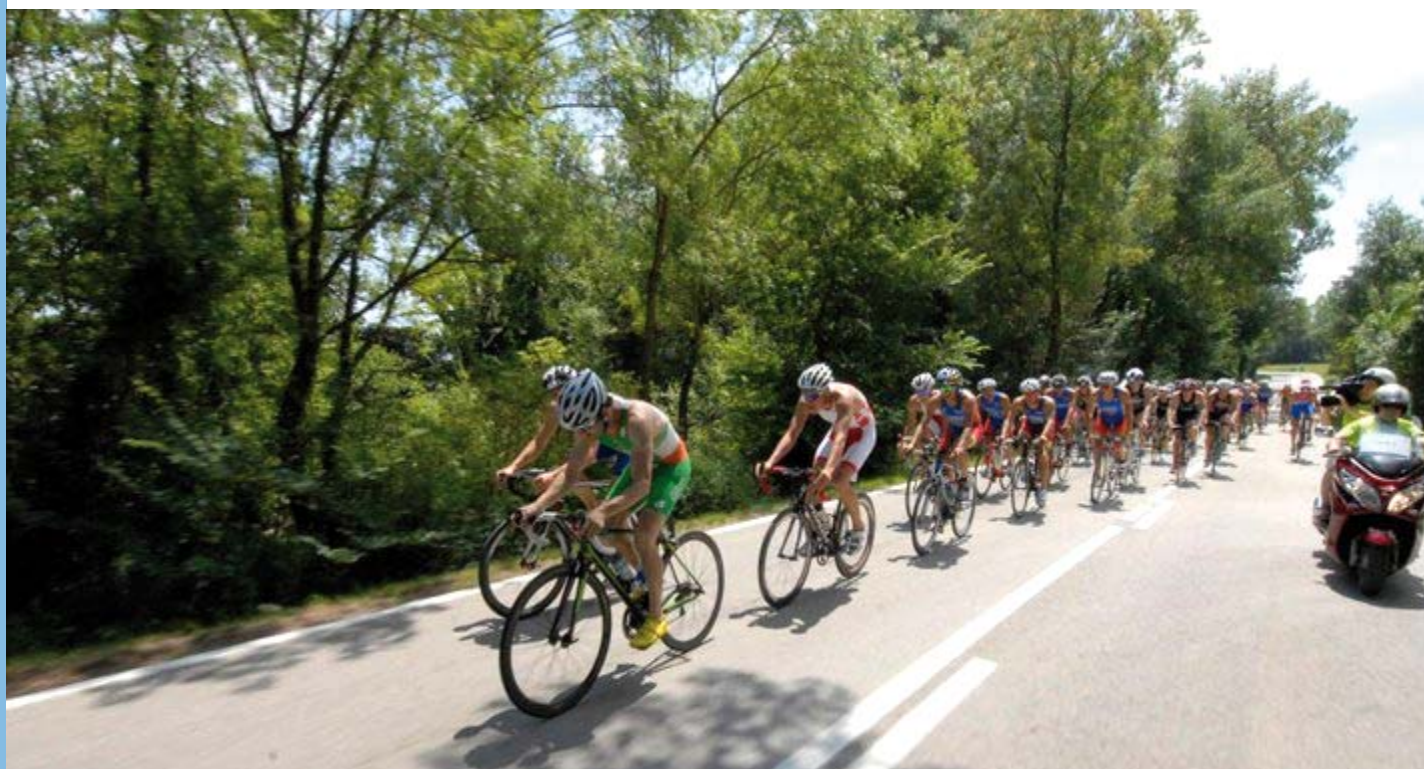
Els triatletes amb bicicleta al recorregut vorejant l'Estany