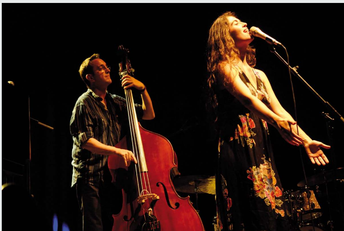
Sílvia Pérez Cruz & Javier Colina Trio a l'(a)phònica