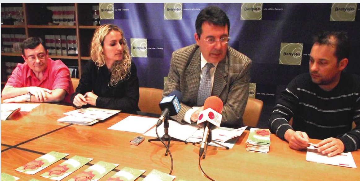
El Juny gastronòmic del Pla de l'Estany arriba a la setena edició