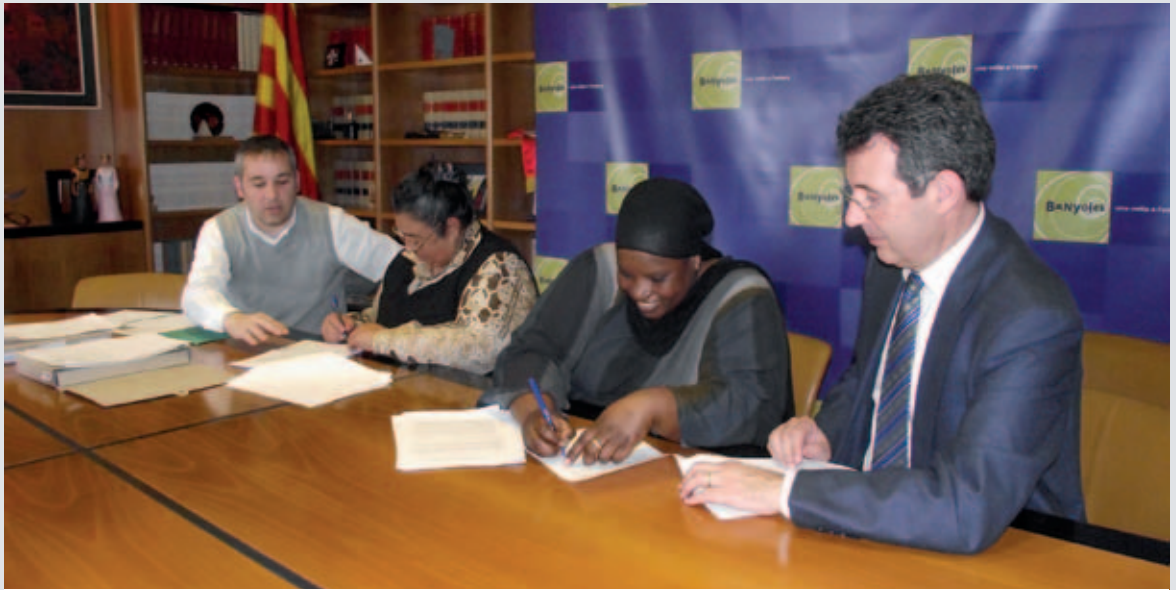
Dues de les famílies beneficiàries dels pisos de lloguer social de Banyoles