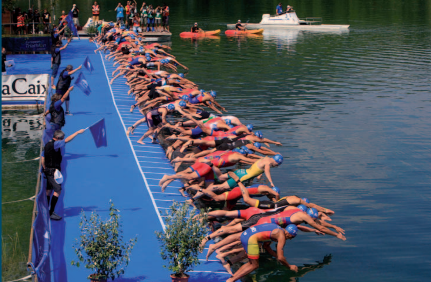
Espectacular sortida de la prova masculina de la Copa d'Europa de triatló.