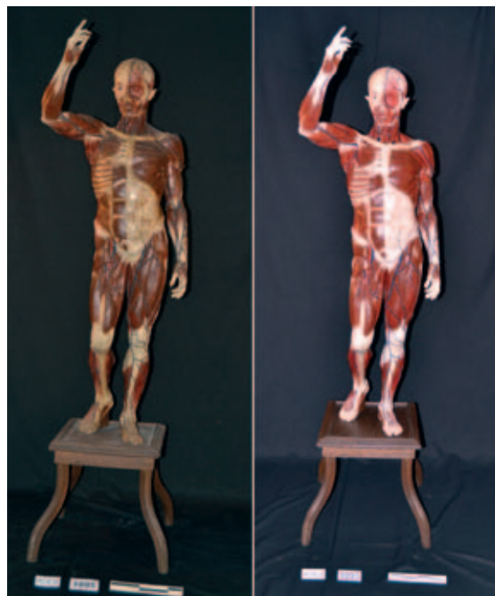
L'home anatómic abans (a l'esquerra) i després de la restauració (a la dreta)

L'any 2013 el Museu Darder va rebre aquesta donació i els tècnics del Museu van decidir dedicar aquests diners a la restauració de l'home anatómic, una peça emblemàtica de la Col·lecció Darder que fins ara no s'havia restaurat pel seu elevat cost. Amb els diners restants es van restaurar tres ossos humans del crani i un crani humà complet que estan preparats amb finalitats didàctiques.