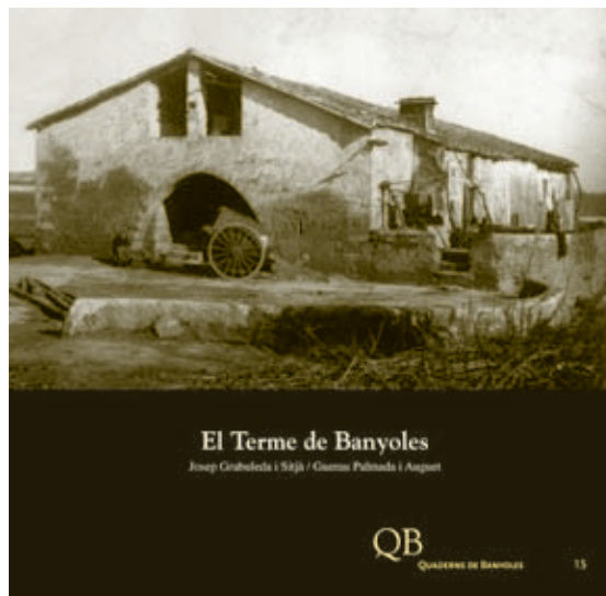
Portada del nou llibre "El Terme de Banyoles"