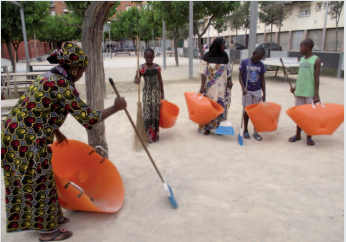
Participants al projecte de conscienciació sobre la neteja a la plaça de la Pau

Les activitats concretes són un taller de reciclatge per petits i grans, tallers de jocs per a nens i nenes, sortides familiars a la Draga, i la conscienciació de la neteja de la plaça de la Pau. La neteja per part dels veïns en cap cas substitueix la feina habitual de l'empresa concessionària de la neteja de la ciutat.