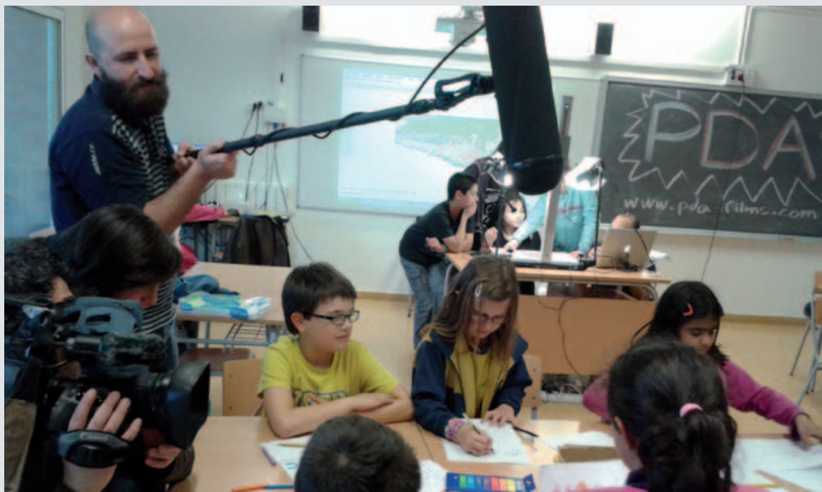
Els nens i nenes dels barris de Can Puig i Canaleta preparant els dibuixos

Durant aquest curs 2013-2014 la regidoria d'Ensenyament de l'Ajuntament i els instituts d'educació secundària de la ciutat han desenvolupat conjuntament aquest projecte. Aquesta activitat s'emmarcava en el treball sobre emprenedoria des d'una metodologia d'aprenentatge - servei, on es pretenia que els nois i noies, partint de l'observació de la ciutat o de les necessitats detectades per diferents agents, projectessin idees sobre com resoldre-les mitjançant un projecte emprenedor.