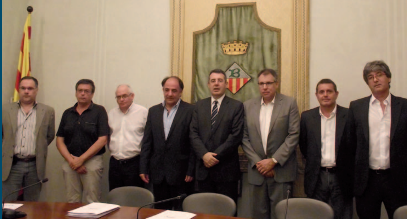
Els integrants de la nova associació Confia'ns a l'Ajuntament

L'Ajuntament de Banyoles convoca els Premis Banyolí de l'Any amb l'objectiu de posar de relleu l'important tasca que fan persones, empreses, entitats o associacions del municipi.