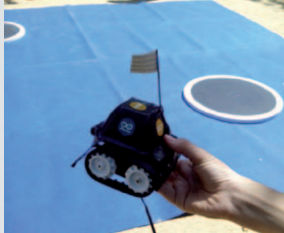
Un dels robots ja acabats i a punt per la competició de "minisumo"

És un projecte de la Càtedra UNESCO de Polítiques Culturals i Cooperació de la Universitat de Girona, ConArte Internacional i PDA Films amb la col·laboració de l'Ajuntament de Banyoles i l'Obra Social Fundació "la Caixa". Consisteix en un seguit de tallers en els quals els nens i nenes han treballat al voltant de temes seleccionats que permeten potenciar la seva creativitat. Seguidament, els professionals facilitaran el procés de convertir les seves històries i els seus dibuixos en el material audiovisual, com ara un curtmetratge i el material pedagògic que l'acompanya.