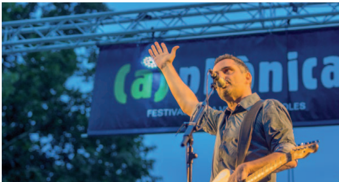
Jorge Drexler a l'(a)phònica

Els llaços de Banyoles amb Polònia s'enforteixen el 2014 a través de la música i de les arts plàstiques. Es