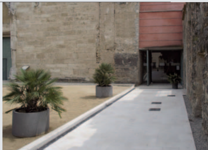
L'entrada del claustre del monestir de Sant Esteve després de les obres

S'han renovat 118 punts de llum de Vapor de mercuri (VM) per Vapor de sodi d'alta pressió (VSAP) per il·