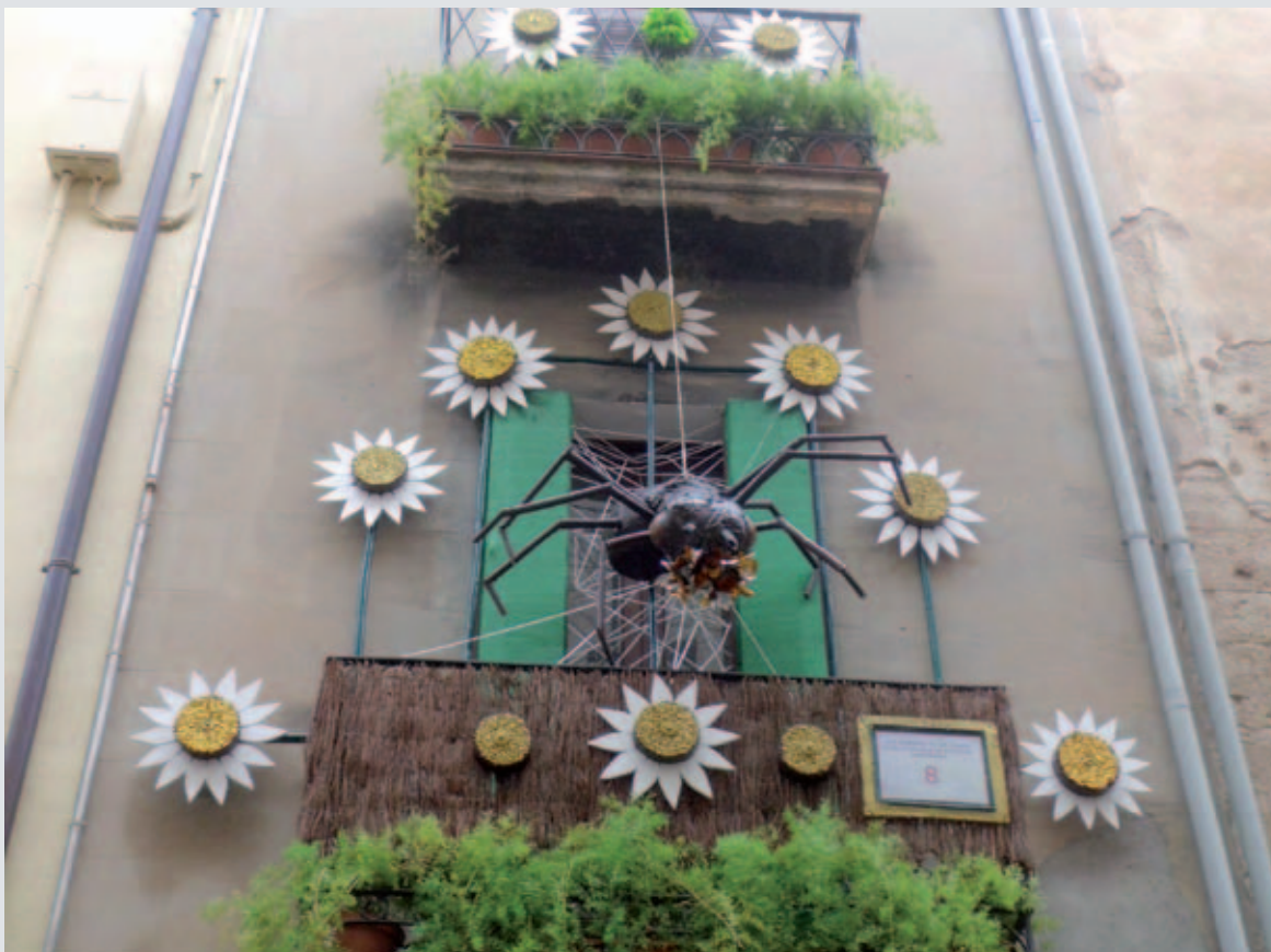
Primer premi de balcó artístic de la 37a Exposició de flors

any l'espai central era el claustre del Monestir de Sant Esteve, la resta d'espais florals, balcons i entrades del Barri Vell i aparadors.