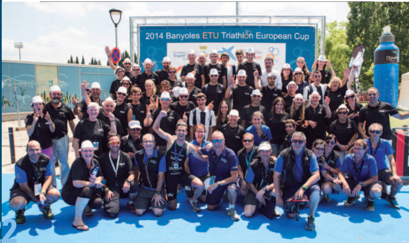
Gràcies a més de 250 voluntaris Banyoles va acollir aquesta prova internacional.