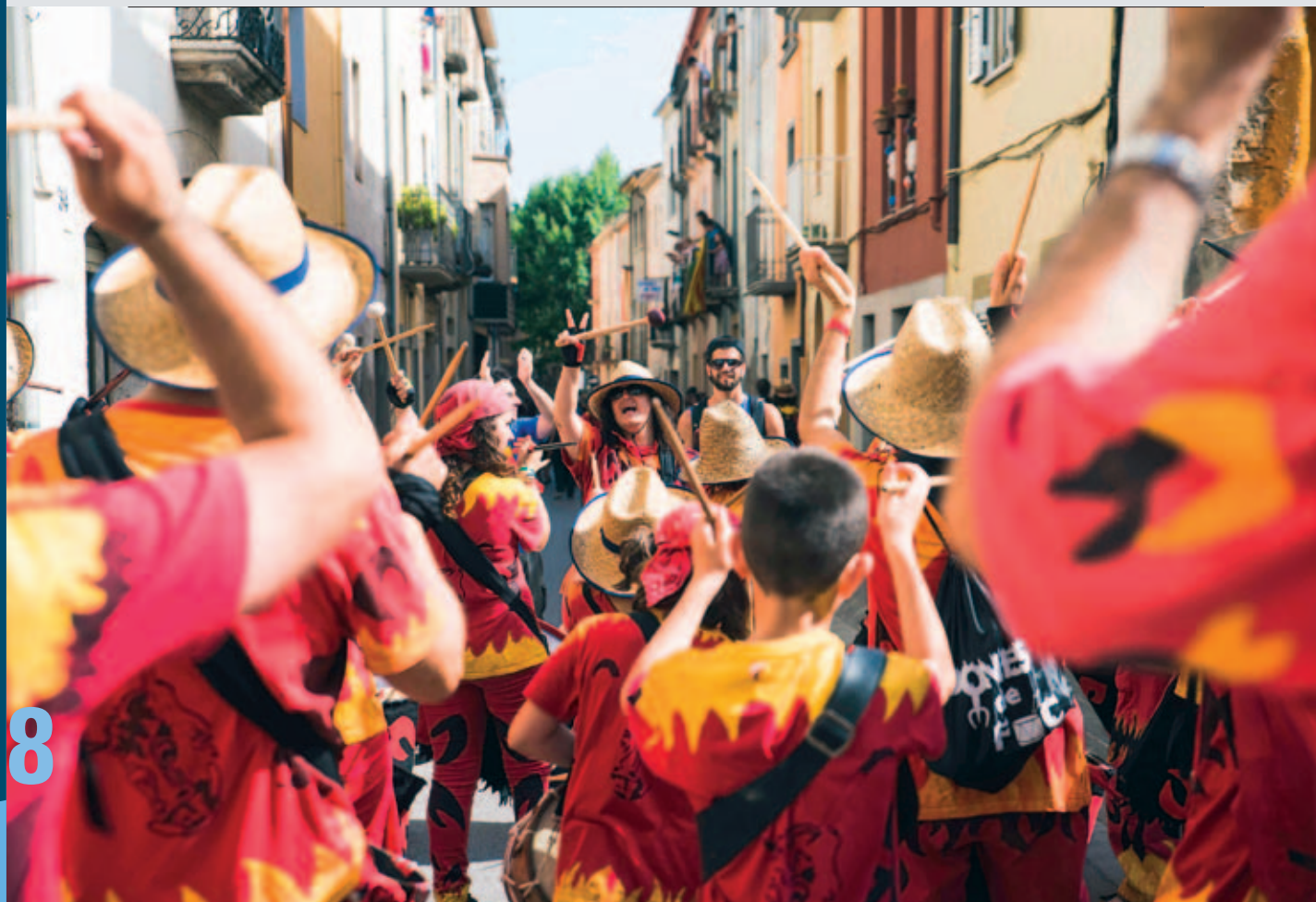
Una de les moltes actuacions de la Fira del Món del Foc.