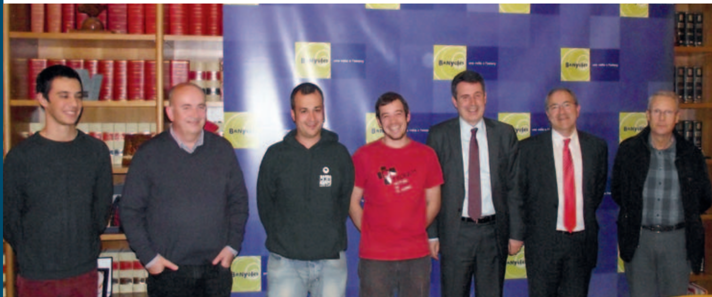
Les entitats de Festes després de la signatura dels convenis