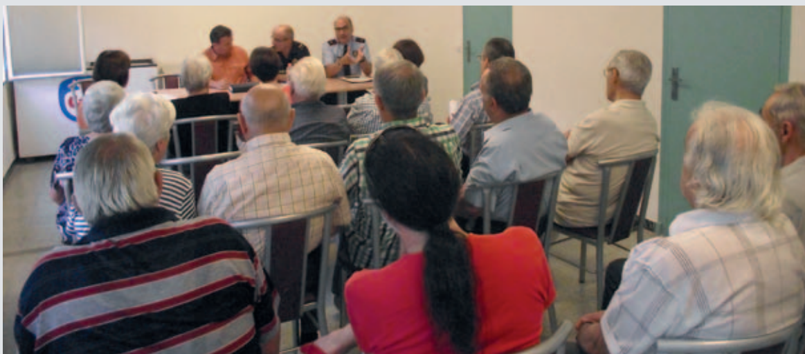
Consell de barri de Mas Palau

el mandat anterior es va iniciar el Consell de barri de Sant Pere i enguany s'ha creat el consell de barri de Mas Palau. Els consells de barri de Banyoles pretenen garantir i impulsar la participació dels veïns i veïnes de Banyoles, i de les associacions, en els assumptes municipals. Són consells de participació que tenen caràcter consultiu, de formulació de propostes i suggeriments.