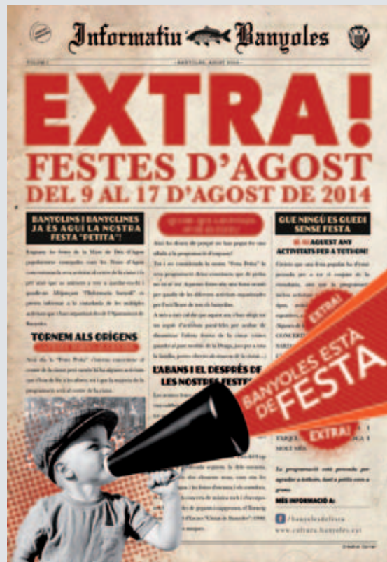
Enguany el cartell de les Festes d'Agost era obra de Lorena Rodríguez, de Creative Corner Agency

L'Ajuntament de Banyoles organitza l'Exposició de flors amb la col·laboració d'un llarg llistat d'entitats, empreses, comerços i particulars. Es van programar concerts, un taller floral infantil, visites guiades a l'arqueta de Sant Martíà, la IV Trobada d'acordionistes ciutat de Banyoles, la 4a Mostra d'entitats d'acció social del Pla de l'Estany, i molta màgia ja que l'Exposició de Flors es va barrejar el mateix cap de setmana amb el 4t Festival de màgia al carrer "Troba'm". Com cada