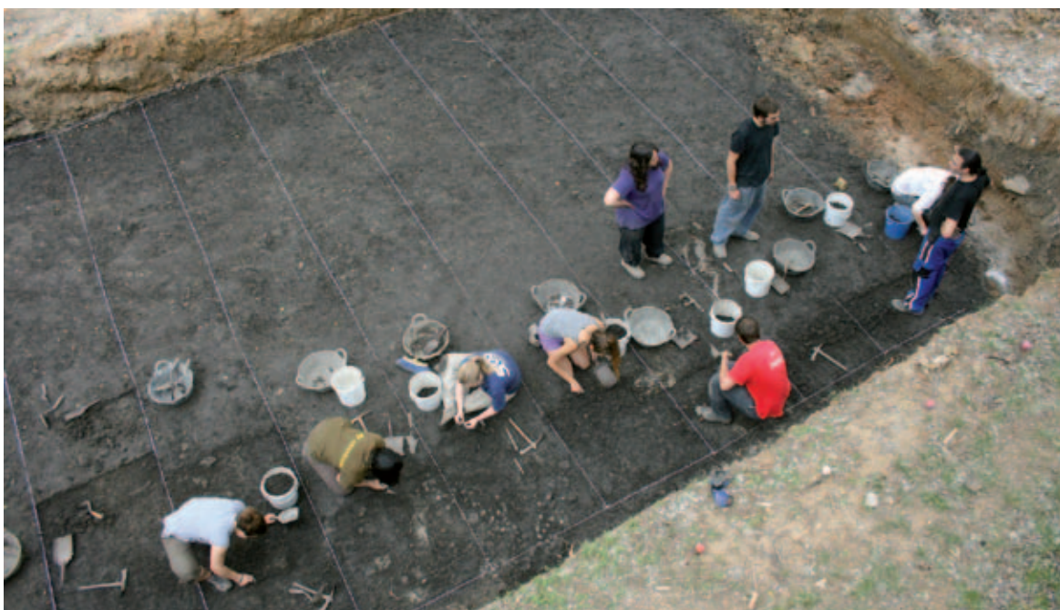
Els arqueòlegs excavant al jaciment de la Draga

Els treballs arqueològics, coordinats pel Museu Arqueològic de Banyoles, són duts a terme pel Consell Superior d'Investigacions Científiques, la Universitat Autònoma de Barcelona i el Museu d'Arqueologia de Catalunya. Enguany, s'ha treballat en un sector que es va iniciar l'any 2013 i s'han documentat les construccions de cabanes. Els treballs han localitzat més pilars de fusta conservats en el nivell freàtic. A més, s'ha confirmat l'existència a la Draga d'un taller dedicat a la fabricació d'elements ornamentals. Aquest estiu s'han programat jornades de portes obertes al jaciment.