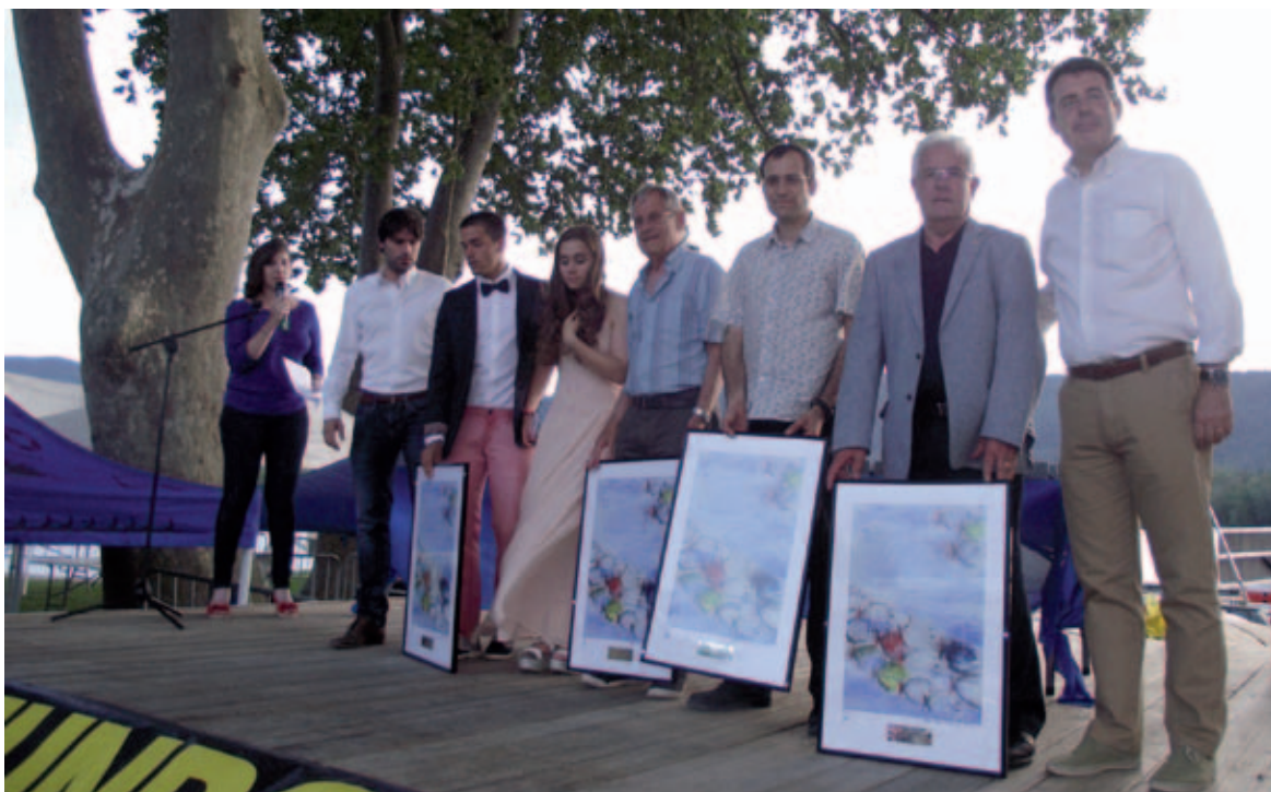
Els guanyadors de la Festa de l'esport banyolí 2013

Amb l'organització de l'Ajuntament de Banyoles i l'associació Triatló Banyoles, i amb la col·laboració del Club Natació Banyoles. La prova va començar amb 1.100 metres de natació a l'Estany, seguidament va ser el tron del circuit de BTT amb uns 13 quilòmetres, i finalment una cursa a peu de 7 quilòmetres. I com a prova popular que és, tot plegat va acabar amb una botifarrada popular acompanyada de festa amb música.