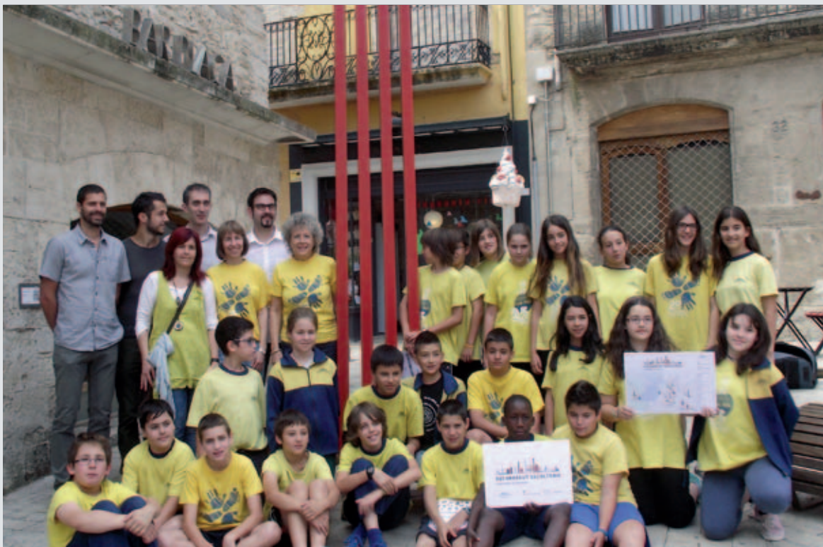
L'escultura Catalan Power, de l'artista Andreu Alfaro, és una de les escultures de la ruta