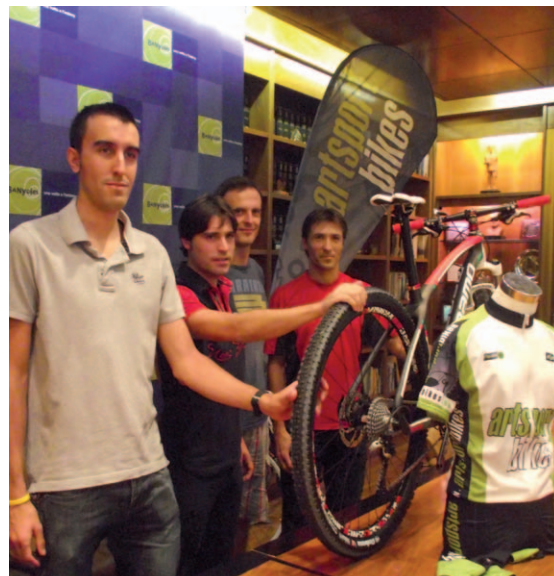
Nova entitat esportiva a Banyoles, el Club Esportiu Artsport

És un club de ciclisme en general, però enfocat a la bicicleta de muntanya de base, un buit en aquests moments a Banyoles. També, s'engegaran cursos, sortides en bicicleta, un campus a l'estiu... Com a activitat extraescolar enguany començaran amb el BTT. Han programat dos grups: iniciació des de segon a sisè de primària i tecnificació a partir d'ESO.