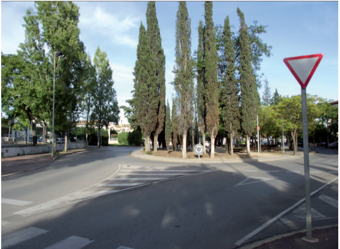
La plaça de Sant Pere actualment