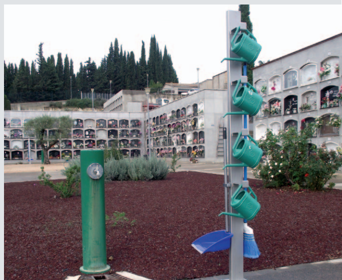
El cementiri municipal de Banyoles amb les regadores i a la part superior l'ampliació dels nínxols

Per altra banda, l'Ajuntament de Banyoles ha ampliat el cementiri municipal en un total de 52 nous nínxols situats a la part superior del cementiri. L'ampliació ha costat uns 33.000 euros.