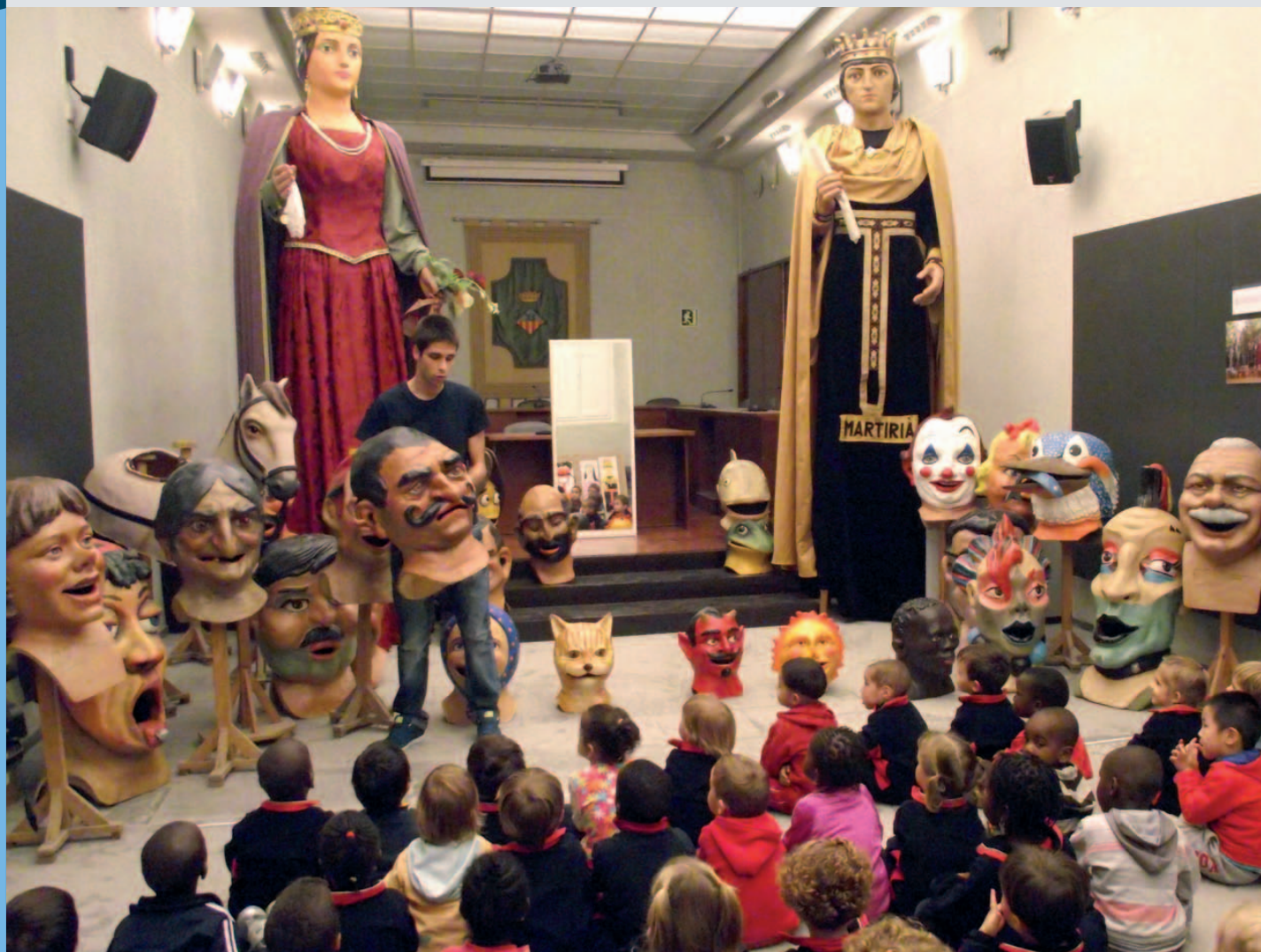
Els nens i nenes bocabadats davant dels gegants i els capgrossos

La Unitat d'Escolarització Compartida, UEC Banyoles, impulsada per l'Ajuntament de Banyoles i el Departament d'Ensenyament, juntament amb els centres educatius de secundària de la ciutat, i el Projecte Drac de l'Institut Pere Alsius i Torrent són dos projectes d'atenció educativa que compten amb la col·laboració d'una borsa d'empreses col·laboradores que va creixent i ja són gairebé vint. Aquesta col·laboració és molt positiva pel creixement personal de l'alumnat.