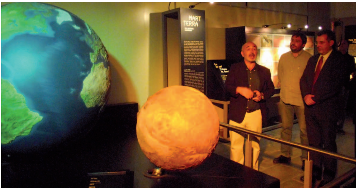
Inauguració de la concorreguda exposició "Mart - Terra. Una anatomia comparada"