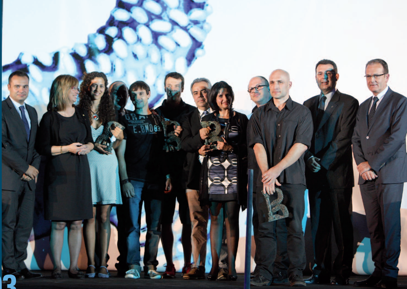
Els guanyadors de la IV edició dels Premis Banyolí de l'Any acompanyats d'autoritats i personalitats.