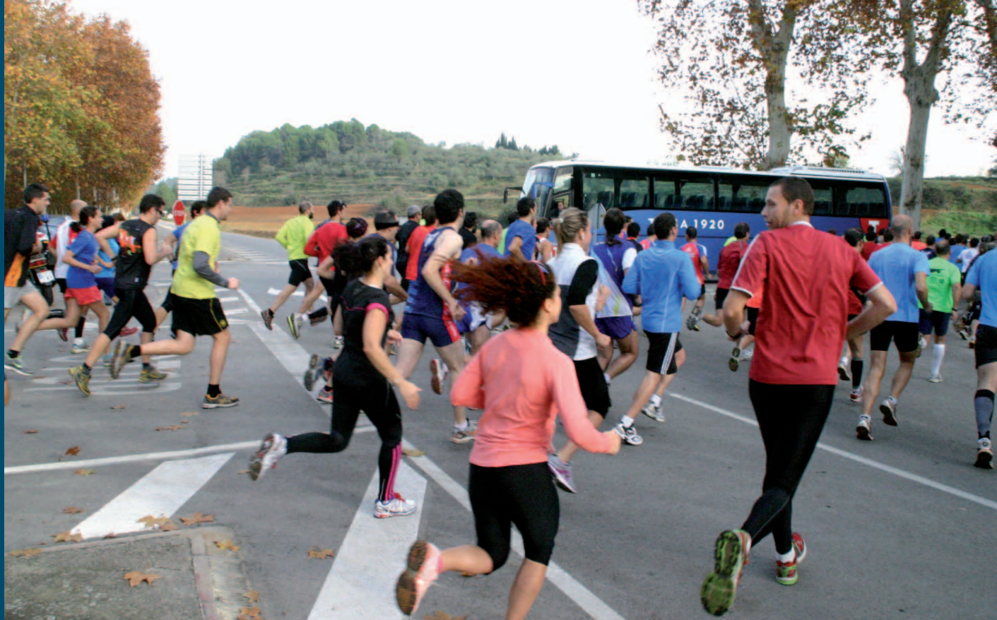
Primers metres de la VI Marxa Popular Ciutat de Banyoles.