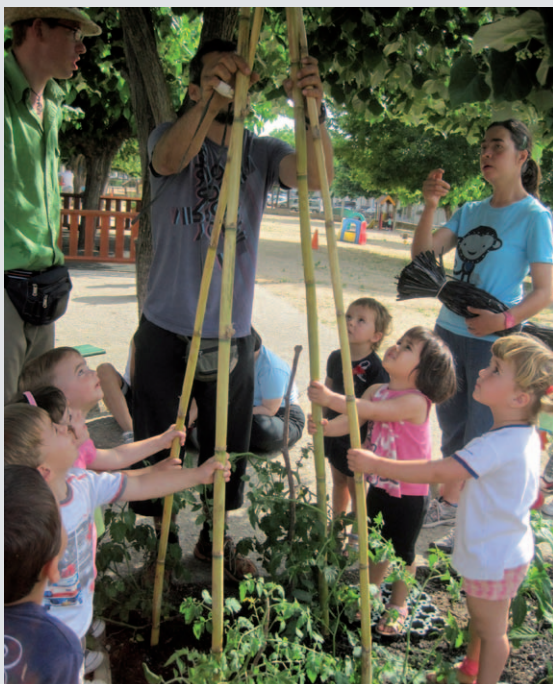
Els nens i nenes de la Balca aprenen què és un hort