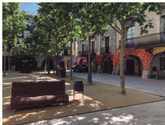
Les Guerrillers del Ganxet van fer un muntatge als arcs de la plaça Major, un dels espais de l'Exposició de Flors.

L'Exposició de Flors es va descentralitzar en diferents espais de la ciutat amb 16 escoles i centres educatius de Banyoles i comarca que van decorar els diferents rentadors de Banyoles tot creant una ruta floral.