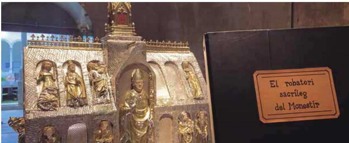
La visita guiada ressegueix el robatori de l'Arqueta de Sant Martirià

Els Museus de Banyoles han estrenat aquest estiu aquesta nova visita guiada que s'oferirà mensualment i on els visitants resseguiran els passos que els lladres van fer per endur-se les peces del Monestir de Sant Esteve. L'11 de gener de 1980, de nit, quan tothom dormia, un dels tresors més preuats de Banyoles, l'Arqueta de Sant Martirià, descansava tranquil·lament a la sagristia de l'església del Monestir de Sant Esteve fins que va desaparèixer.