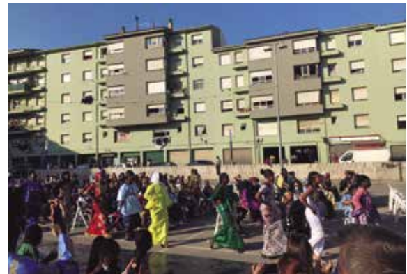
La Festa del Xai va incloure una desfilada de roba.

El 24 de juliol es va celebrar una jornada cultural al barri de la Farga, coincidint amb la Festa del Xai de la comunitat musulmana. La iniciativa va néixer de joves de l'associació banyolina Comunitat Musulmana, amb el suport de l'Ajuntament, i va consistir en balls, desfilades de roba moderna de l'Àfrica subsahariana i desfilada de marques afropanyolines, i actuacions musicals i teatrals.