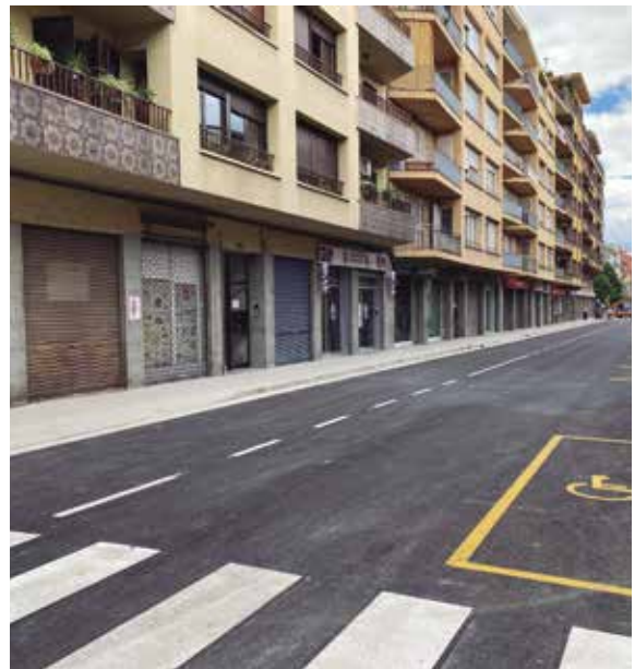
S'han completat els treballs de la segona fase del carrer Llibertat, entre els carrers Canat i Rotes

En aquesta darrera part del projecte, els treballs s'han centrat en el tram del carrer que va del carrer de les Rotes al Camí de l'Horta. En aquesta tercera fase, i a banda de la construcció de nous col·lectors de desguàs i sanejament al carrer, els treballs han suposat també la construcció de noves escomeses per als habitatges, així com les connexions als edificis de la zona de Cal General. Amb aquesta instal·lació, les aigües brutes i les pluvials han quedat canalitzades per separat, en comptes de fer-ho per una única canalització com fins ara. Amb les obres, s'ha renovat també la xarxa d'aigua potable i la xarxa elèctrica, que s'ha soterrat, i s'ha renovat el ferm del carrer. Els treballs estan pressupostats en 444.785,63 euros, dels quals més de la meitat s'han finançat a través del Pla Únic d'Obres i Serveis de la Generalitat.