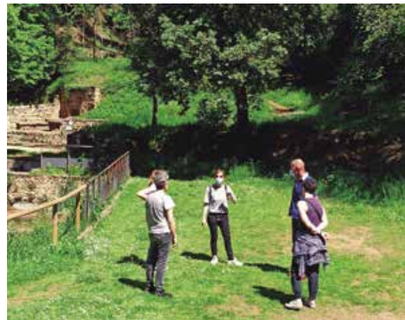
Participants a l'experiència turística al bosc de Can Puig

S'hi inclouen propostes de benestar, natura i turisme actiu per a tots els públics i que es poden fer en un o dos dies. La iniciativa inclou tres propostes: el bany de bosc al barri de Can Puig, la Marxa Nòrdica i el passeig en la barca Tirona.