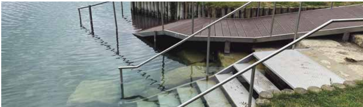
La Caseta de Fusta després de les millores

uns 30 metres des de la riba. L'horari de bany durant el setembre serà de les 2 del migdia a les 7 de la tarda, de dilluns a divendres, i de les 11 del matí a les 7 de la tarda, els caps de setmana.