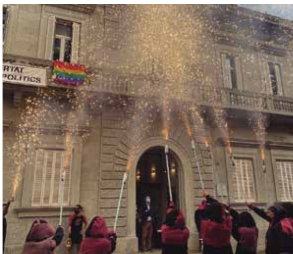
Acte de Sant Joan a davant de l'Ajuntament on es va fer la rebuda institucional de la Flama del Canigó