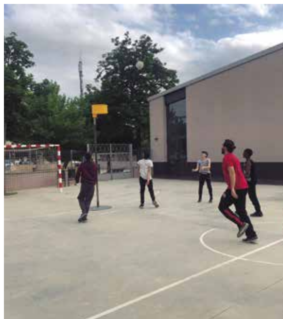
Una de les activitats de Tarda jove a l'escola Baldiri Reixac.

Barris 10 és un programa social, educatiu, obert i inclusiu que, a través de la promoció de l'activitat física i l'esport en infants i adolescents, pretén potenciar la cohesió social entre els més joves. Les accions del programa es fonamenten en la inclusió, la igualtat d'oportunitats i de gènere, el respecte i la tolerància, la visió comunitària i el desenvolupament constant de les habilitats per la vida. El programa es va iniciar en el curs 2018-2019 i en aquesta tercera edició incloïa els projectes FutbolNet, Tarda Jove, Joves en Dansa i Esport i barris.