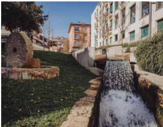
S'ha reformat en tres fases el tram urbà del rec Major des del carrer Muralla al carrer Blanquers.

El nou itinerari ressegueix el recorregut del rec Major des de l'Estany, començant just al costat dels Banys Vells, fins al centre i sud de Banyoles per conèixer el desenvolupament industrial de la ciutat, que ha anat estretament vinculat a la presència de l'aigua al llarg de la història, però també de la importància de l'aigua, de la presència de l'Estany i del seu ecosistema. Està senyalitzada amb plafons que incorporen codis QR perquè el visitant pugui tenir també la descripció en diferents idiomes perquè s'ha fet en català, castellà, anglès i francès. L'itinerari es pot fer individualment o a través d'una nova visita guiada que oferiran els Museus de Banyoles. A més, des de l'Oficina de Turisme s'ha editat una nou fulletó turístic que n'explica el recorregut i que també es pot trobar a la pàgina web turisme.banyoles.cat .