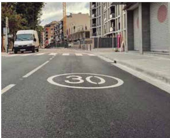
Al carrer Llibertat no es pot superar la velocitat dels 30 quilòmetres a l'hora.

A partir d'ara el límit és de mitjana de 30 quilòmetres per hora i afectarà a tots els vehicles que circulin pel nucli urbà de la ciutat, tot i que hi haurà excepcions en determinades vies i zones tant en velocitat més alta com en velocitat més baixa. Els nous límits de velocitat van entrar en vigor després que la Direcció General de Trànsit (DGT) acordés una nova normativa per reduir la velocitat a l'interior de les ciutats amb l'objectiu de reduir els morts per accidents de trànsit. Quedaran fora d'aquesta nova normativa tots aquells eixos de la xarxa bàsica que creuen la ciutat per connectar amb municipis veïns. També hi haurà un límit específic de velocitat de 20 quilòmetres per hora, per exemple, a tot el Barri Vell i a l'entorn d'escoles.