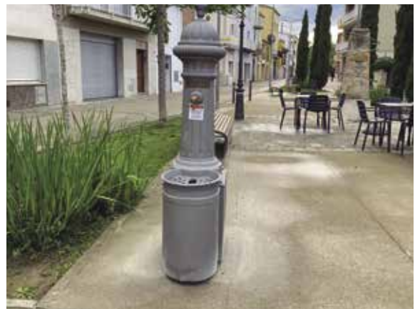
La font arranjada a la placeta del Carme

L'antiga font de la placeta del Carme ja torna a lluir a la seva ubicació original després dels treballs de restauració que han permès recuperar-la.