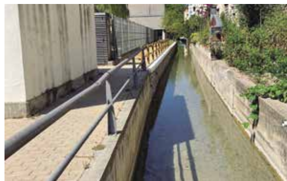
El rec d'en Teixidor després de la millora

regular els cabals dels recs i la cota de l'Estany, amb un nou model que garanteixi el pas de la fauna. Els treballs estan adjudicats per uns 84.000 euros, finançats fins al 70% amb aportacions del Pla Únic d'Obres i Serveis de Catalunya.