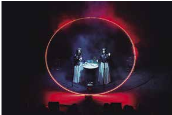
Concert de Tarta Relena a l'Auditori de l'Ateneu.

El Festival de la Veu de Banyoles, (a)phònica va tancar la 17a edició amb una molt bona valoració tant per l'afluència de públic com per les propostes programades. Entre el 24 i el 29 de juny es van poder veure una trentena d'espectacles amb la veu com a protagonista, per a tots els públics. De les 33 propostes, tant gratuïtes com de pagament, 27 van exhaurir totes les localitats: Albert Pla, Joan Garriga i el Mariatxi Galàctic, Tarta Relena, San Salvador, Nacho Vegas i Rodrigo Cuevas, entre moltes d'altres. El festival ha comptat amb un 91,17% d'ocupació de mitjana.