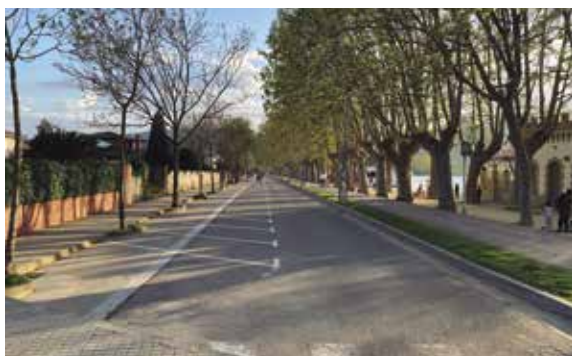
El passeig Darder continuarà lliure de cotxes els caps de setmana i dies festius.

La mesura suposa restringir la circulació de vehicles en aquest entorn fins al final d'any. La mesura afecta el tram del passeig Lluís Marià Vidal, des del carrer Prior Agustí fins al Passeig Mossèn Lluís Constans, i el tram del Passeig Darder, entre el mateix Passeig Mossèn Lluís Constans fins al carrer Pintor Winthuysen.