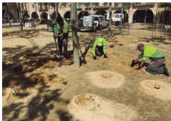
Operaris del centre El Puig treballant a la plaça Major

L'Àrea de Medi Ambient de l'Ajuntament de Banyoles, amb el suport del servei de jardineria del centre El Puig, van tractar als plàtans de la plaça Major per promoure'n el creixement. S'ha decidit fer una actuació per descompactar el terreny, amb la realització d'uns forats al voltant de cada arbre a través dels quals s'aportaran graves i carbó actiu a les arrels. D'aquesta manera, es vol esponjar el terra, omplir d'aigua i aconseguir que les arrels trobin forats per seguir creixent.