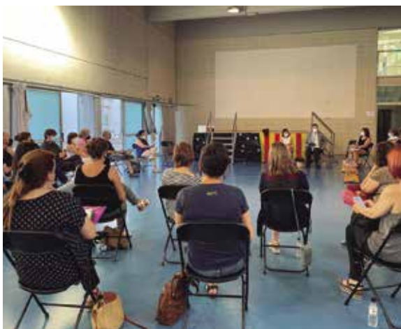
Membres del Consell escolar municipal de Banyoles

La sessió plenària del Consell Escolar Municipal (CEM) del 21 de juny va ser la primera que s'ha pogut dur a terme des que es va declarar la pandèmia provocada pel COVID. El plenari del CEM va coincidir amb el final de curs; es va aprovar la memòria del curs passat, es va parlar sobre els resultats de les preinscripcions i es van aprovar els dies de lliure disposició dels centres pel curs vinent, 2021-2022, entre d'altres qüestions.