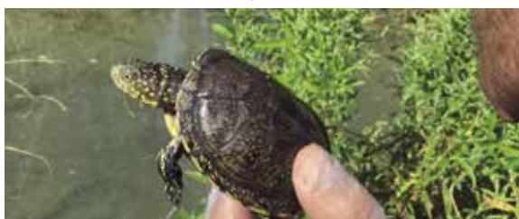
Un dels exemplars de tortuga alliberats

Són 5 femelles i 3 mascles procedents del Centre de Recuperació de Tortugues de l'Albera en una acció del