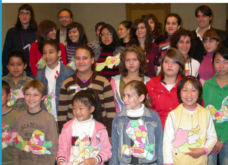
Nova implementació a Banyoles del Projecte Rossinyol