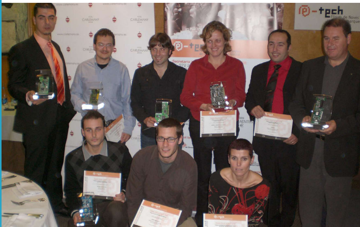
Els premiats, entre ells Ràdio Banyoles

El portal www.radiobanyoles.cat es va posar en marxa fa uns dos mesos, coincidint amb l'inici de la temporada 08-09. El portal web, elaborat per l'empresa Interactiu, inclou l'actualitat local i comarcal, espai per a tots els programes fets pels col·laboradors i també informació institucional.