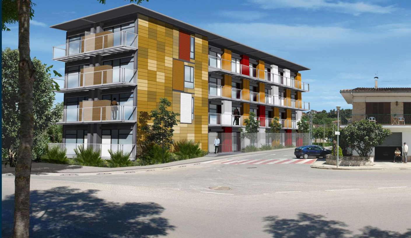
Simulació de com quedaran les 30 vivendes que aniran ubicades al c/. Orfes