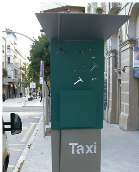
La nova marquesina pel telèfon dels taxis

Aquesta nova parada es troba al carrer Països Catalans, 252 (davant de la Caixa de Girona).