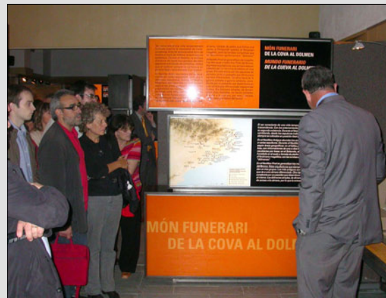
Inauguració de l'exposició "Sedentaris. Els primers poblats a Catalunya".

La Biblioteca Pública de Banyoles consolida la bona acollida del projecte de creació d'un grup de voluntaris per atendre a persones amb mobilitat reduïda i portar-los llibres als domicilis, llegir a persones amb problemes de visió i recollir les seves vivències, entre altres. Aquest mes d'octubre s'ha ampliat el nombre de voluntaris de 6 a 15 persones, amb la finalitat de potenciar la Biblioteca Pública de Banyoles com un espai social i de participació integral de la ciutadania.