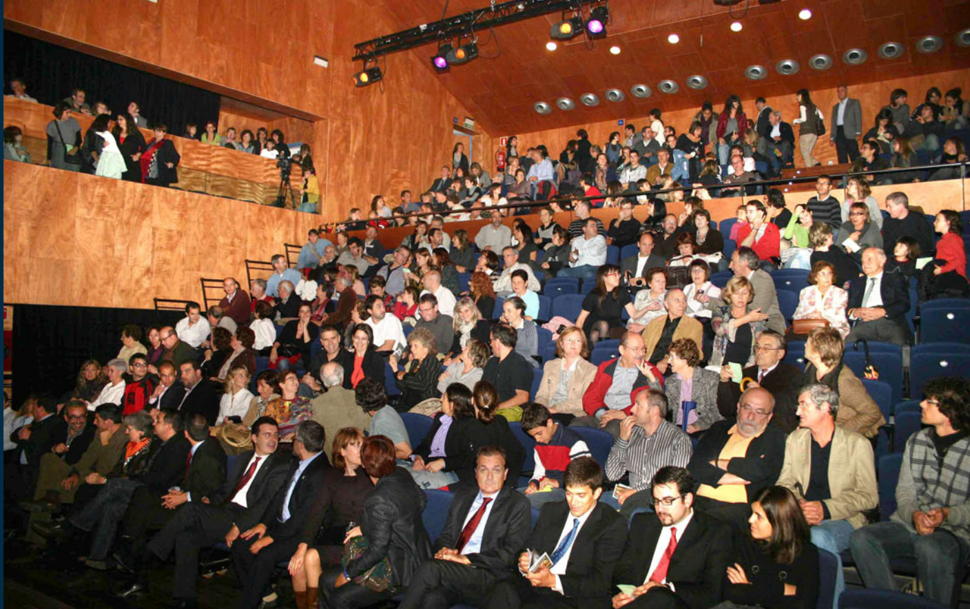
Les grades es van omplir el dia de la inauguració de l'Auditori de l'Ateneu.