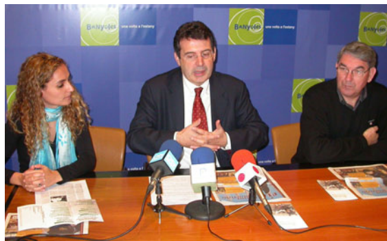
Presentació de la 30ena edició de la Fira de Sant Martirià

Unes 32.000 persones van visitar la 30ena Fira de Sant Martirià de Banyoles. A banda de la seva activitat relacionada amb el món del cavall i les races autòctones dels Països Catalans, va constar d'altres activitats com