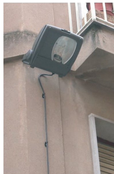
Renovació de l'enllumenat del Barri Vell