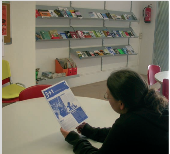
Espai Jove ubicat a la Vila Olímpica

A través de l'entitat Psicojove es va instal·lar un punt de salut jove a l'espai de les barraques amb motiu de la Festa Major. Així mateix, està en fase de redacció un nou Pla local de Joventut per tal de marcar les directrius dels propers anys en política de joventut. Aquest pla té en compte el diàleg i l'intercanvi d'opinions fruit de les trobades i reunions amb els joves.