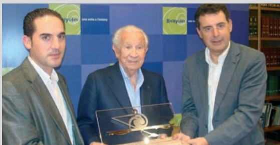
Banyoles acollirà una prova de la Copa del món de Rem del 2009

Banyoles és una ciutat d'una tradició esportiva eminent i reconeguda. La seva participació (i organització) en múltiples esdeveniments esportius, així com la distinció que ostenta com a destinació turística esportiva, fan que l'Ajuntament aposti per donar un suport absolut a l'esport en totes les seves manifestacions.