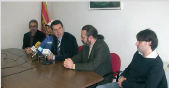
Presentació del Campionat d'Espanya de Marató en Piragüisme