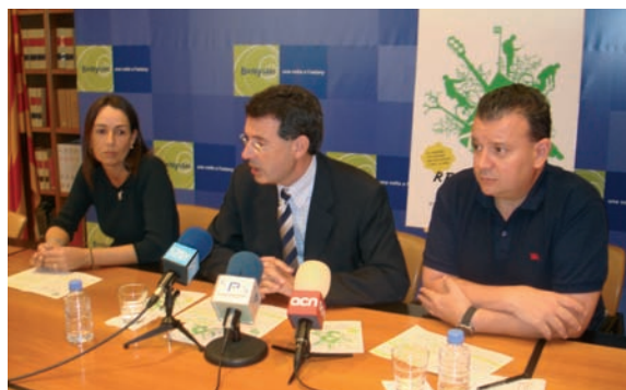
Setmana de la mobilitat

La participació ciutadana s'entén com una forma de comunicació entre els ciutadans i l'Ajuntament. Amb els consells de barri i escoltant els ciutadans en totes les actuacions realitzades s'avança en l'objectiu d'assolir una forta implicació dels banyolins i banyolines amb la ciutat.