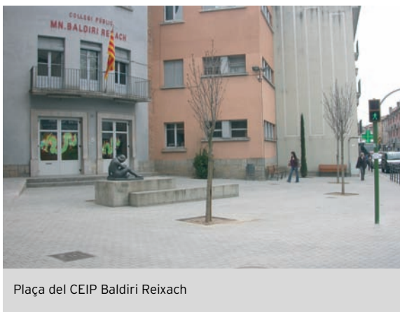
Plaça del CEIP Baldiri Reixach