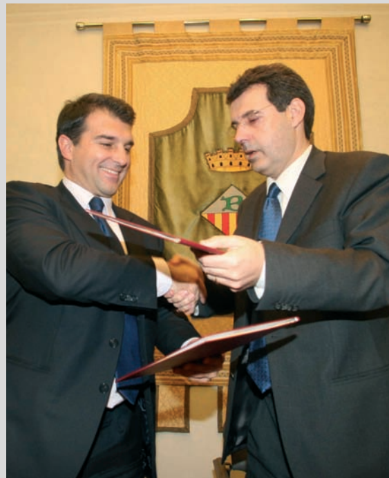
Conveni entre l'Ajuntament de Banyoles i el FC Barcelona / Foto: Pere Duran

Tanmateix, hem signat un conveni de col·laboració amb el grup Damm pel qual col·laboraran en l'organització de diversos actes esportius i culturals del municipi.