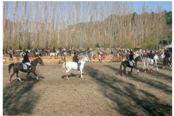
Fira de Sant Martíà

Quant al comerç s'han fet enquestes als comerciants per tal de copsar la seva opinió sobre l'actual ubicació del mercat setmanal. Així mateix, i en el marc del Pla de dinamització del mercat de Banyoles, es va posar en marxa la campanya promocional de Nadal , que va incloure informació, sortejos i demostracions gastronòmiques. Nogensmenys, hem treballat per la continuïtat del Firestoc , atès que es tracta d'un referent en aquesta mena d'esdeveniments a les comarques gironines. També hem endegat campanyes com el "Banyoles en Joc" , una eina que ha de potenciar el petit comerç en dates en què les vendes experimenten un lleuger descens i que tenen com a objectiu la fidelització del client, captar-ne de nous i alhora divulgar la