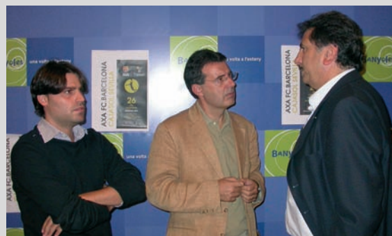
Presentació del partit de bàsquet entre el Futbol Club Barcelona i el Cajasol Sevilla