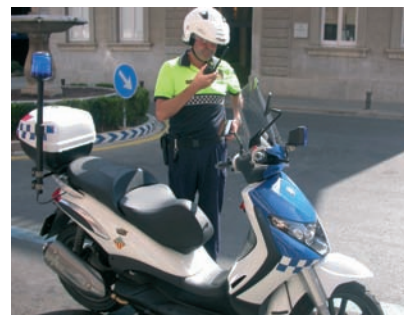
Nova moto pel servei de policia de proximitat