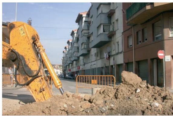
Obres al carrer Girona