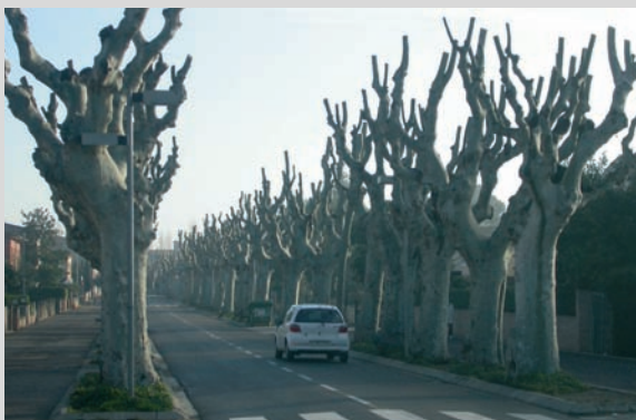
Els arbres de la Puda després de la poda