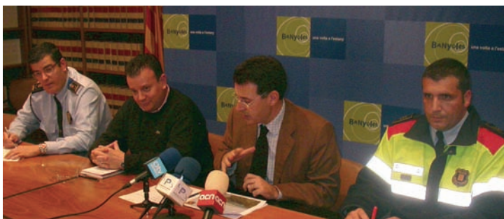
Roda de premsa posterior a la Junta Local de Seguretat

Amb tot, l'equip de govern confia en la prevenció, i és per això que ha aprovat els plans d'emergència Inuncat (en cas de forts xàfecs), Neucat (en cas de fortes nevades) i el Sismcat (en cas de produir-se sismes).