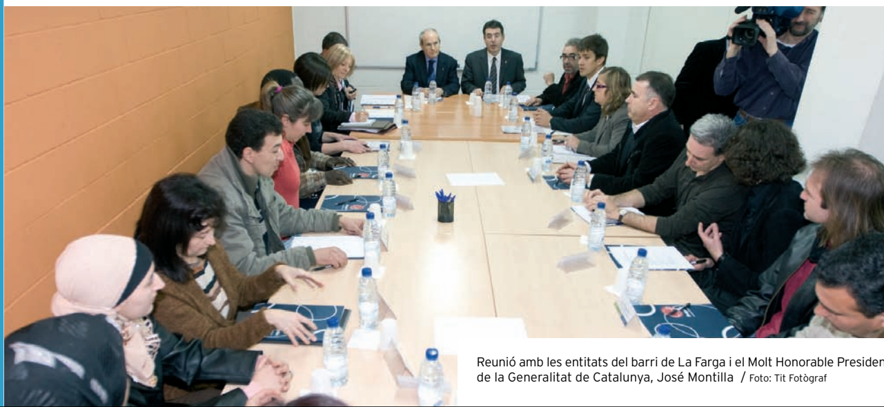
Reunió amb les entitats del barri de La Farga i el Molt Honorable President de la Generalitat de Catalunya, José Montilla

La participació també s'ha prioritzat amb activitats lúdicoformatives com la Setmana de la mobilitat sostenible i segura a Banyoles o el llibre virtual impulsat pel Centre Cívic Banyoles.