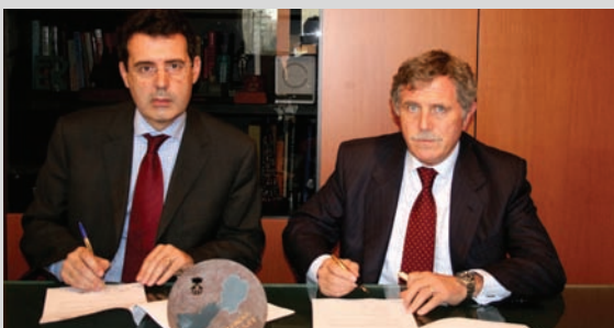
Conveni amb la Damm

Des de l'actual consistori es treballa per mantenir la línia endegada amb anterioritat però amb la ferma voluntat de potenciar encara més l'esport, tant l'esport de base i la formació com la celebració d'esdeveniments esportius a la nostra ciutat. Tot això, sense menystenir la necessària millora i ampliació de les instal·lacions esportives.