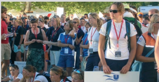
Campionat universitari de rem

Banyoles és una ciutat d'una tradició esportiva eminent i reconeguda. La seva participació (i organització) en múltiples esdeveniments esportius, així com la distinció que ostenta com a destinació turística esportiva, fan que l'Ajuntament aposti per donar un suport absolut a l'esport en totes les seves manifestacions.