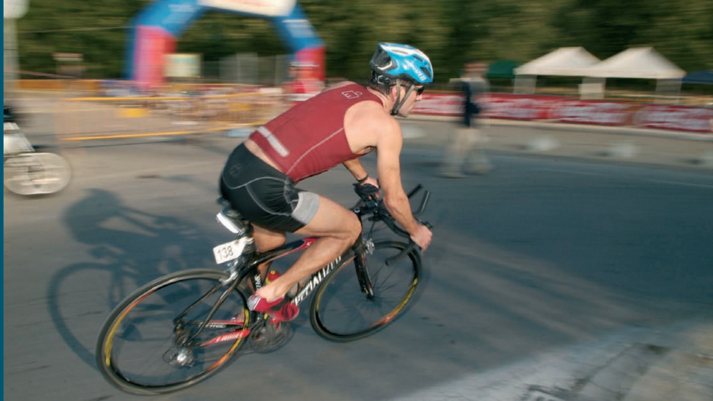
Triatló "B" Banyoles-Pla de l'Estany