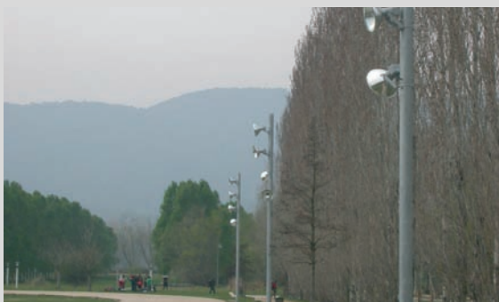
Enllumenat de la pista d'atletisme