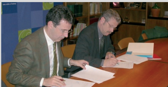
Banyoles serà arribada i sortida d'etapa de la 88a edició de la Volta Ciclista a Catalunya