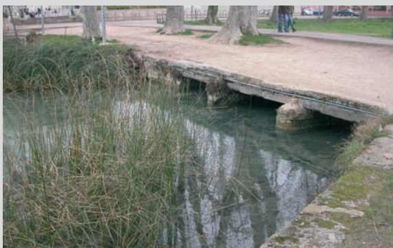
Neteja del front d'estany