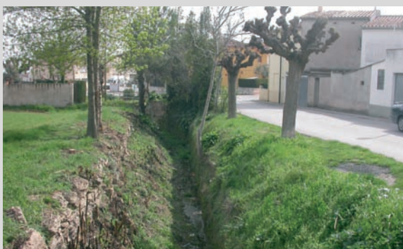
Neteja de la riera Canaleta

Nogensmenys, l'Ajuntament ha volgut esdevenir referent en matèria de mobilitat sostenible; en conseqüència, ha comprat dues bicicletes per tal que els treballadors municipals les utilitzin en els seus desplaçaments laborals.