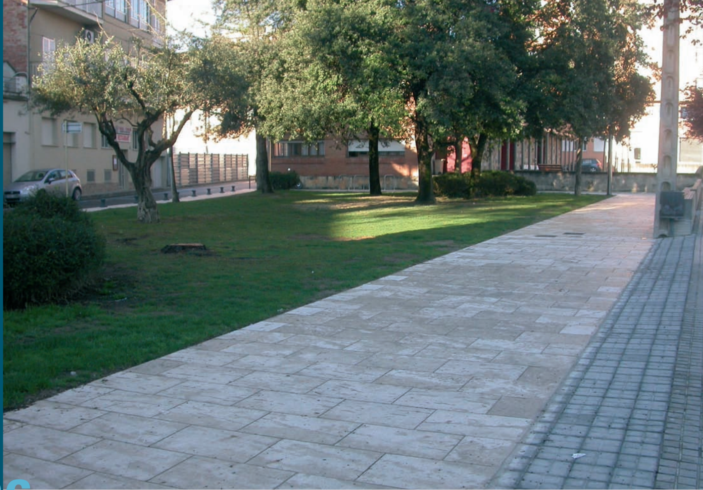
La plaça Pau Casals després de les obres