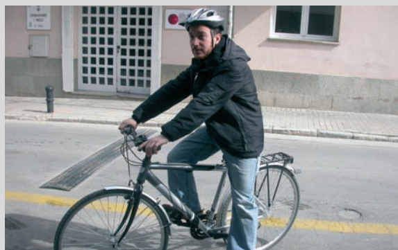
Compra de dues bicicletes