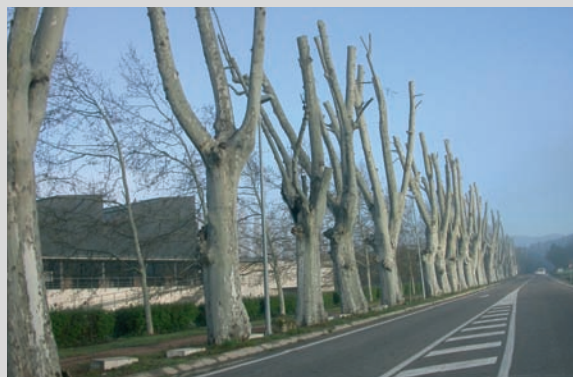
Els arbres podats de la carretera C-66 al seu pas pel parc de la Draga de Banyoles