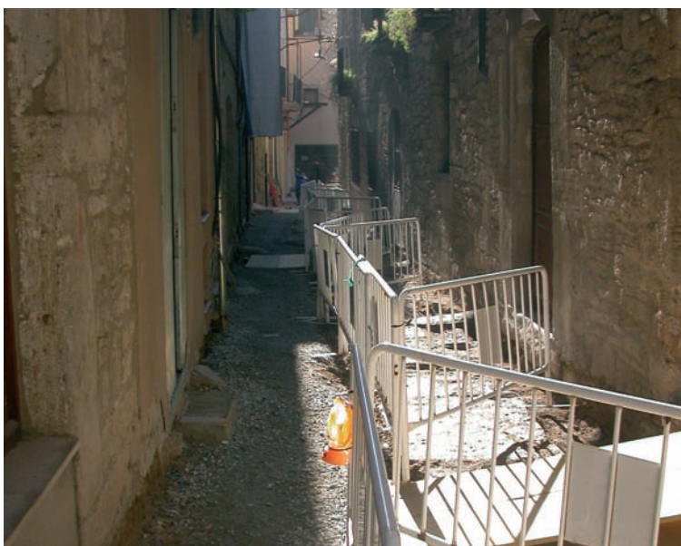
Obres de millora del carrer Paraireria

El carrer Girona connecta el barri de la Farga amb el centre de la ciutat, motiu pel qual s'ha apostat per la seva millora de la mateixa manera que s'ha treballat en la rehabilitació de l'enllumenat del casc antic . Així mateix s'ha remodelat la plaça de davant del CEIP Baldiri Reixach , s'han fet obres al carrer Canat (entre els carrers Llibertat i Sant Martírià), s'ha licitat l'obra per obrir el carrer de la Lluna , s'ha reformat la plaça Jurats (davant la clínica Salus Infirmary), la plaça dels Turers , el carrer Jaume Butinyà i s'ha renovat el paviment de la plaça Pau Casals . Finalment, s'està urbanitzant un tram del rec Major a l'entorn del Camp de futbol vell i s'estan fent les obres del carrer Paraireria, la plaça de la Font i el carrer Escrivanies.