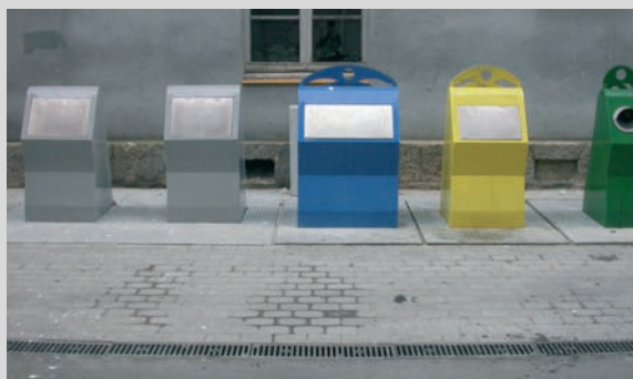
Contenidors soterrats al carrer Canat