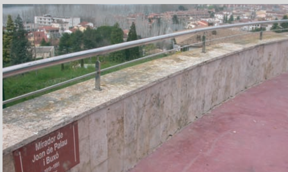
Neteja de grafits al mirador Joan de Palau

L'increment de les places d'aparcament , la renovació de senyals de trànsit , la substitució de bancs que eren molt vells, les mampares pels contenidors al carrer Canaleta, el soterrament dels contenidors del carrer Canat i moltes altres actuacions demostren la implicació de l'Ajuntament en les petites accions i en els detalls quotidians de la ciutat.