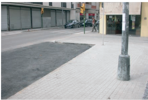
Plaça dels Turers