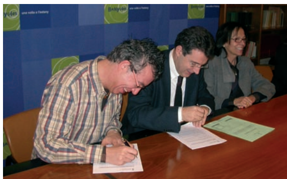
Conveni amb la Creu Roja

Al barri de la Farga s'està avançant en el Projecte de rehabilitació integral amb actuacions de caràcter urbanístic i polítiques socials. Per aprofundir amb la millora del barri s'han contractat, gràcies a l'aportació de l'Ajuntament de Banyoles i a una subvenció atorgada pel Servei d'Ocupació de Catalunya i el Fons Social Europeu, un agent d'ocupació i desenvolupament local, quatre persones pel projecte de brigada de neteja, tres treballadors pel projecte de brigada de microurbanisme, i dues persones pel projecte per l'educació dels hàbits mitjançant el lleure.