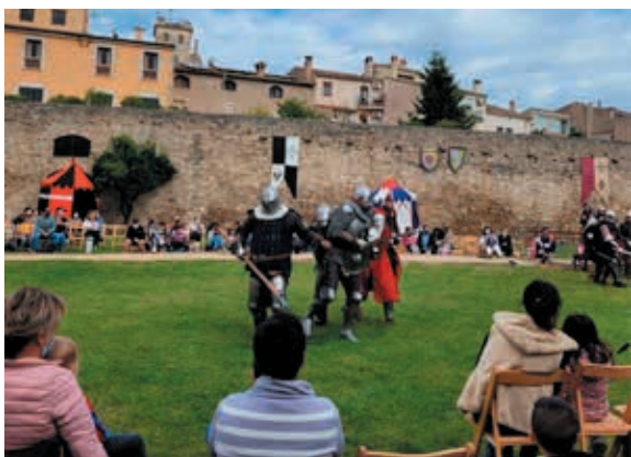
La Fira Aloja va retornar l'espai de la Muralla a l'època medieval

L'arqueta de Sant Martíà va centrar aquesta edició de l'Aloja celebrada el segon cap de setmana d'octubre i on es van viure activitats per a tots els públics com ara espectacles de recreació històrica, activitats infantils, mercat medieval o exposicions. Els espectacles de recreació històrica a la Muralla de la companyia Alma Cubrae van ser els de més èxit de públic i el mercat medieval de la plaça Major va reunir 45 parades.