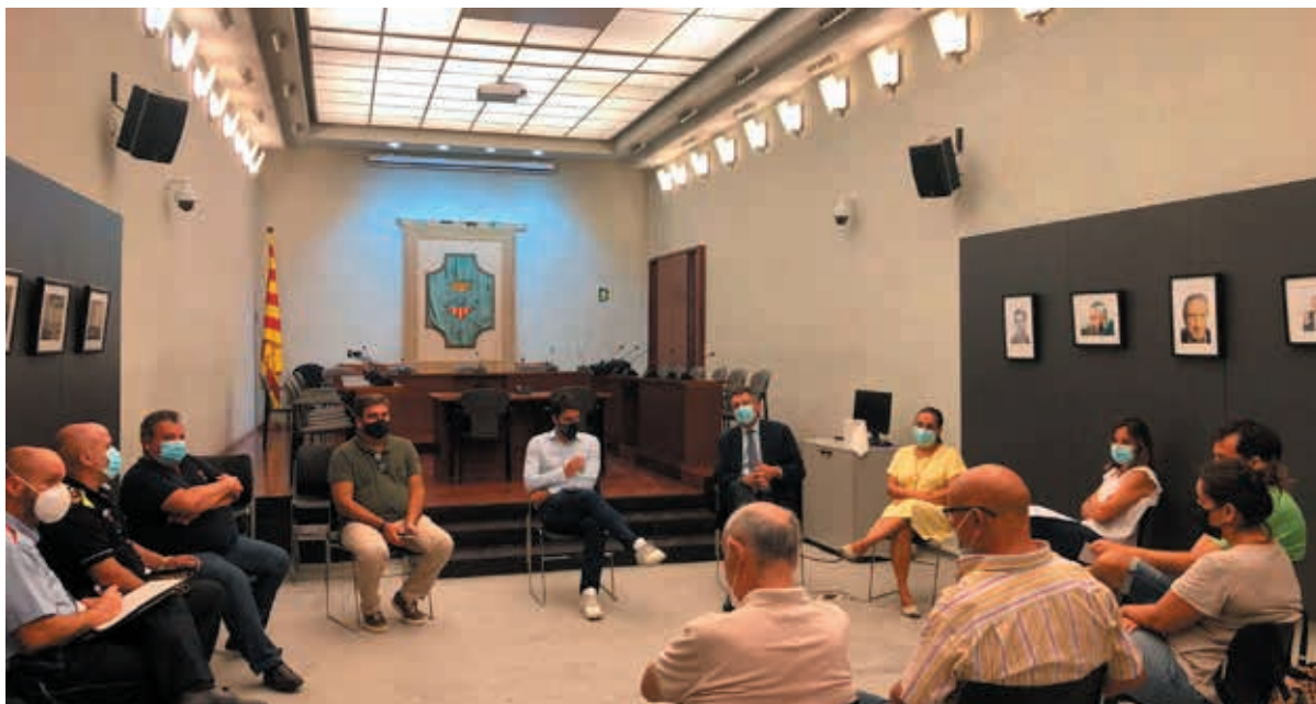
Reunió amb l'associació de veïns de Canaleta

CaixaBank, a través d'una aportació econòmica de la Fundació "la Caixa", ha mostrat el seu suport a tres projectes de l'Ajuntament de Banyoles que se centren en l'esport com a eina d'integració (programa "Pràctica de l'esport com a eina integradora"), l'accessibilitat al lleure (programa "Lleure per a Tothom") i l'ajut a les persones grans vulnerables (programa "Fem companyia").