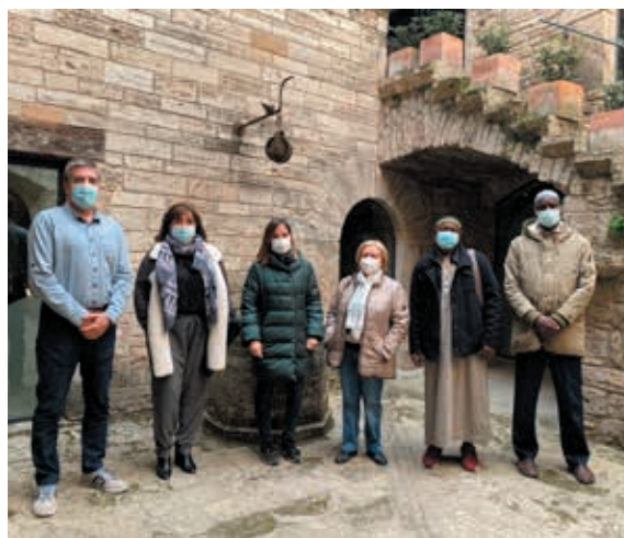
Presentació de la Setmana de la diversitat religiosa

L'Ajuntament de Banyoles i el Consell Comarcal del Pla de l'Estany han organitzat per primera vegada la Setmana de la Diversitat Religiosa, que es va celebrar del 16 al 21 de novembre. Va incloure diferents propostes com ara una visita guiada pels temples de les diferents confessions religioses i l'estrena d'un documental sobre les religions a Banyoles.