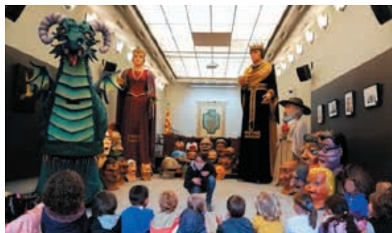
Els nens i nenes visitant els gegants i capgrossos

Per altra banda, es programa la visita escolar Coneguem l'Ajuntament, que es tracta d'una visita guiada per l'Ajuntament de Banyoles, que pretén apropar i donar a conèixer les funcions, organització, funcionament bàsic