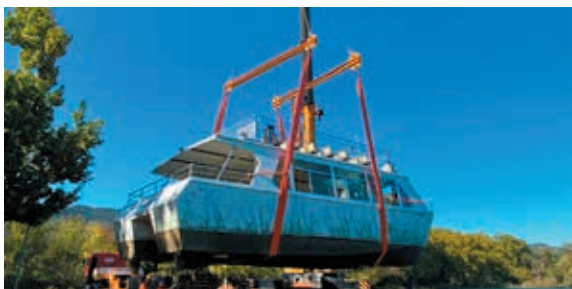
Retirada de la barca per instal·lar les bateries

Aquest octubre un camió i una grua de grans dimensions van treure i tornar a l'aigua la barca Tirona per canviar-li les bateries elèctriques. L'actuació ha costat 85.000 euros. La barca Tirona és propietat de l'Ajuntament, tot i que la gestió i explotació la duu a terme una empresa privada. Alhora, s'ha aprofitat per fer les tasques de manteniment de l'embarcació.