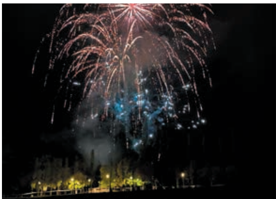
Final de festa amb els focs artificials