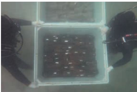
El nou magatzem sota l'aigua del jaciment neolític de la Draga

Les restes vegetals de fusta del jaciment neolític de la Draga ja es conserven en un magatzem subaquàtic excavat prop del jaciment dins l'Estany de Banyoles. S'hi guarden més de 1.200 peces de fusta que ocupen 15 metres cúbics i s'han extret al llarg dels 30 anys de treballs arqueològics al jaciment. A la campanya d'excavacions arqueològiques d'enguany, que es va portar a terme durant el setembre, s'han fet tant en el sector terrestre com en el subaquàtic del jaciment.