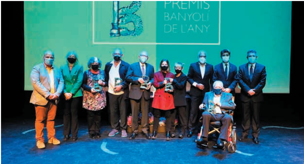
Autoritats i premiats als Premis Banyolí de l'any en el transcurs de l'acte a l'Auditori de l'Ateneu de Banyoles