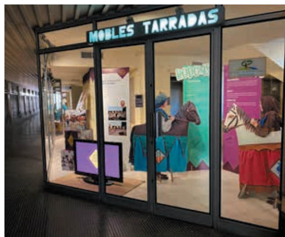
L'espai expositiu municipal Can Tarradas acull l'exposició 'Goita tu, quin ball de passada!'

L'exposició se centra en les figures dels cavallets de la faràndula que han protagonitzat el cartell de la Festa Major d'aquest any, el drac i el tabal. Goita tu, quin ball de passada vol posar en valor la tradició centenària del bestiar i la faràndula de Banyoles i és fruit d'una investigació exhaustiva en arxius i documents històrics. Gegants, capgrossos, cavallets i el bestiar han passejat tant per les festes religioses i populars com pels balls de Passada de la Festa Major. L'exposició es podrà veure ara fins a l'11 de febrer de 2022 a l'espai expositiu municipal Can Tarradas en un nou horari de dilluns a divendres de les 9 del matí a les 8 del vespre.