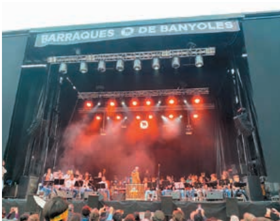
Concert a les Barraques