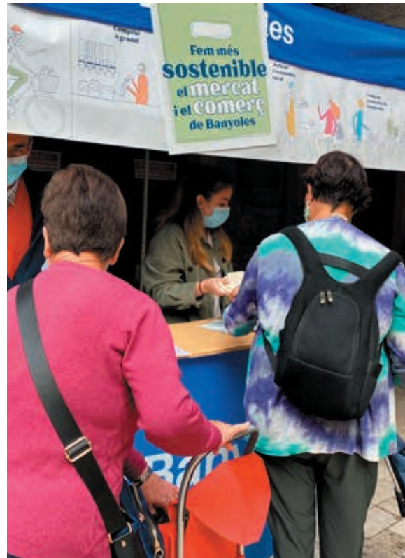
Les clientes del mercat setmanal que utilitzaven envasos reutilitzables en les seves compres van rebre una bossa.

L'objectiu principal de la campanya era aconseguir reduir l'ús de plàstics d'un sol ús tant en el mercat setmanal com en el petit comerç. Per això, durant els dimecres del mes d'octubre es va instal·lar una parada al mercat setmanal on els clients, si ensenyaven la seva compra utilitzant un envàs reutilitzable, s'enduien una bossa de cotó i un val regal de 5 euros per comprar als establiments de l'Associació Banyoles, Comerç i Turisme, fins exhaurir existències. En aquest sentit, el tipus d'envàs utilitzat era el següent: 45% bosses de cotó, 28% carretó, 12% bossa de malla, 7% bossa reciclable, 5% cistells i 3% carmanyoles i altres envasos. En total, es van repartir 900 bosses de cotó i 380 vals de 5 euros per bescanviar en els establiments comercials.