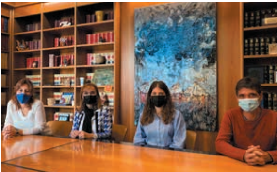
Roda informativa de les millores al carnet jove

A partir d'ara, i a banda dels de Banyoles que ja podien sol·licitar-ho, també la població jove de la resta de municipis del Pla de l'Estany es podrà beneficiar de descomptes i avantatges a comerços, serveis i equipaments municipals. La iniciativa pretén reforçar el teixit comercial de proximitat i compta amb el suport del Consell Comarcal del Pla de l'Estany i l'Associació Banyoles Comerç i Turisme. Des de que es va posar en funcionament, un centenar de joves l'han sol·licitat i s'hi han adherit més d'una vintena de comerços. El nou Carnet Jove #DeBNY es pot sol·licitar, entre d'altres formes, a través de la pàgina web de l'Ajuntament de Banyoles, omplint el formulari que trobaran i es rebrà en format digital.