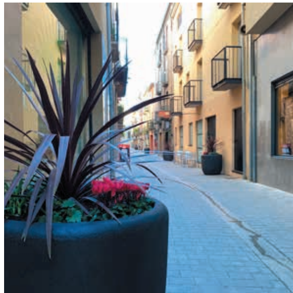
Una de les noves jardineres del carrer Santa Maria

L'actuació s'ha fet als carrers Mercadal, Major, Santa Maria i Canal i han consistit a substituir les anteriors jardineres de ferro, que amb el pas del temps havien quedat malmeses, per unes de noves de formigó negre. També s'ha aprofitat per renovar la jardineria i s'han col·locat plantes i flors. Les tasques, que han suposat una inversió de prop de 20.000 euros, han anat a càrrec de la Brigada Municipal, que s'ha encarregat de retirar les anteriors i de col·locar les noves, i del centre El Puig que s'ha ocupat de la plantació de les noves plantes i flors.