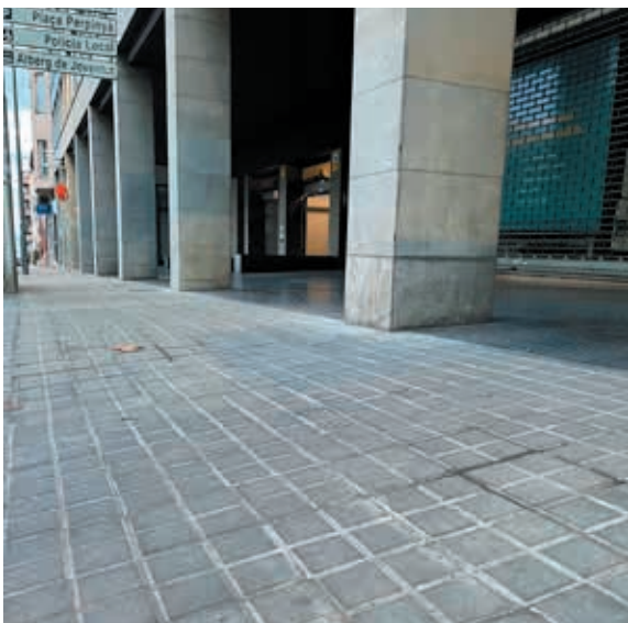
La vorera reformada a l'avinguda Països Catalans

L'Ajuntament de Banyoles ha executat un nou pla de voreres amb l'objectiu de reparar i fer manteniment d'aquelles voreres que es troben en més mal estat. El nou pla té una inversió prevista de 43.439 euros. El pla de voreres ha millorat un tram de la carretera de Camós, aproximadament a l'alçada del carrer Pere Alsius, i a l'avinguda Països Catalans, en el tram entre el passeig de la Indústria i la plaça Perpinyà.